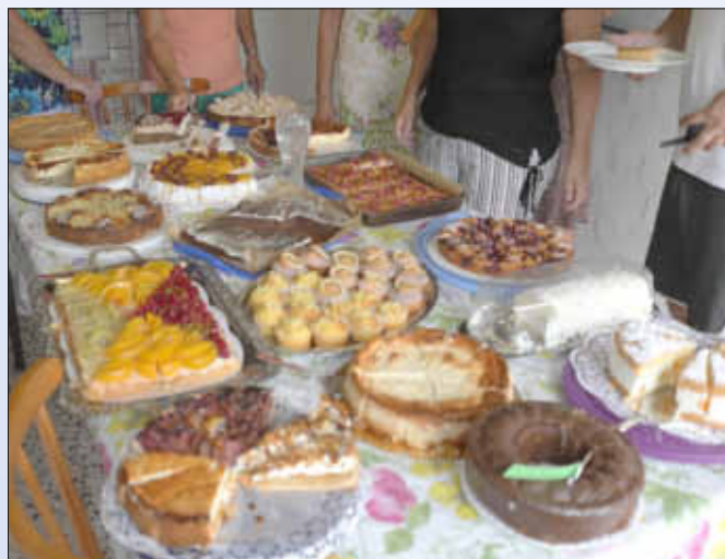
Das Kuchenbuffet bot auch in diesem Jahr eine große Auswahl leckerer Kuchen