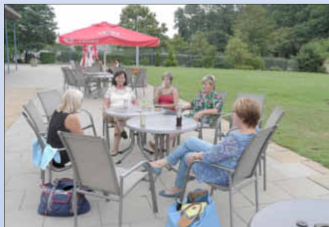
Morgens war erst mal ein Glas Sekt zur Einstimmung gefragt

An dieser Stelle ganz herzlichen Dank an alle Kuchenbäcker und Kuchenesser und vor allem an die Damen-Schwimmgruppe, die den Kuchenverkauf perfekt organisiert hatte.