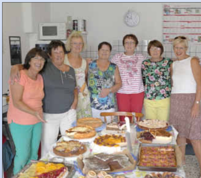
Fröhliche Gesichter bei der „Kuchenbrigade“