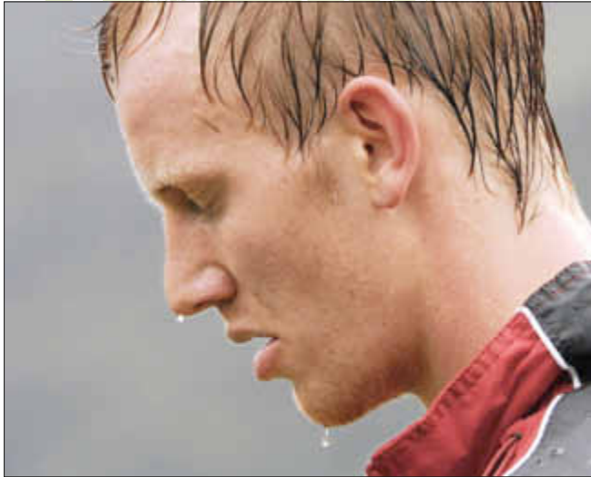
Normale Reaktion: Schwitzen beim Sport

Gerade jetzt im Sommer spüren viele „hautnah“ im wahrsten Sinn des Wortes eine wichtige Reaktion des Körpers, nämlich das Schwitzen. Meistens wird das Schwitzen dann als unangenehm empfunden, obwohl es wichtig und lebensnotwendig ist.