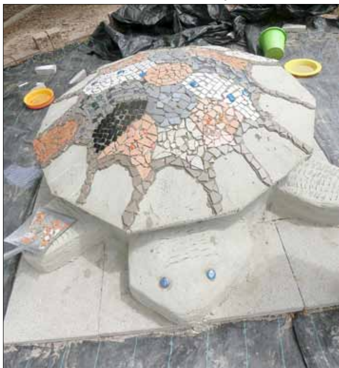
Das Maskottchen des Schulhofes: Ich werde bis zum Fest fertig sein und euch in neuem Look erwarten.

Die Besucher erwartet ein ansprechendes Programm. Der Förderverein wird dabei für das leibliche Wohl der Gäste sorgen.