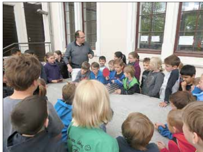
Großer Andrang beim Start des 1. Schultischtennisturniers unserer Schule

Wir bedanken uns beim Wallerfanger Tischtennisclub für seine Unterstützung. hs