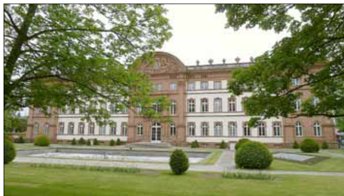
Der Garten des Herzogsschlosses