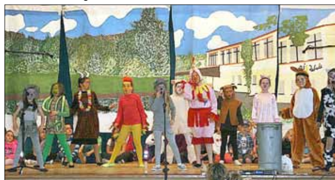
Szene aus dem Musical „Als die Tiere die Schimpfwörter leid waren.“

Die offenen Aufführungen zu diesem tierischen, rasanten Musical finden am Samstag, 13. Juni um 11 Uhr und 15 Uhr in der Grenzlandhalle in Hemmersdorf, am 16. Juni um 10 Uhr im Kulturhaus Hostenbach und am 14. Juli um 10 Uhr in der Walderfingia in Wallerfangen statt. Eingeladen sind alle Menschen, die jung geblieben sind. Der Eintritt zu den Veranstaltungen ist frei.