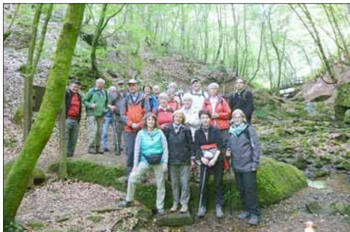
Im Tal des Butzerbaches