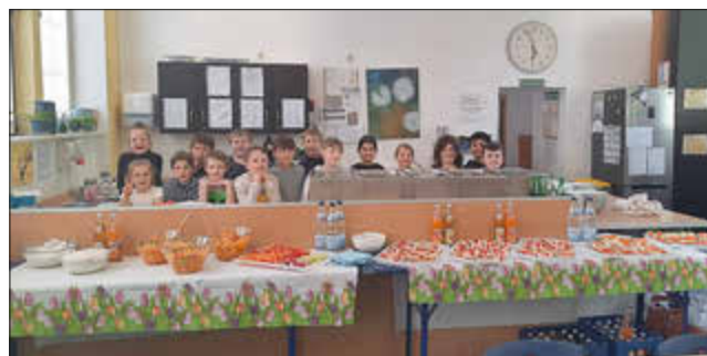
Die stolzen Köche hinter ihrem tollen Buffet

Innerhalb von weniger als 2 Stunden haben die Kinder mit Unterstützung durch einige Mütter und zwei Väter verschiedene Gerichte zubereitet: Brotgesichter, einen vegetarischen Brotaufstrich, Knabbergemüse mit Schnittlauchquark, Nudelsalat, Backofenkartoffeln, Früchtequark und Bananenmilch.