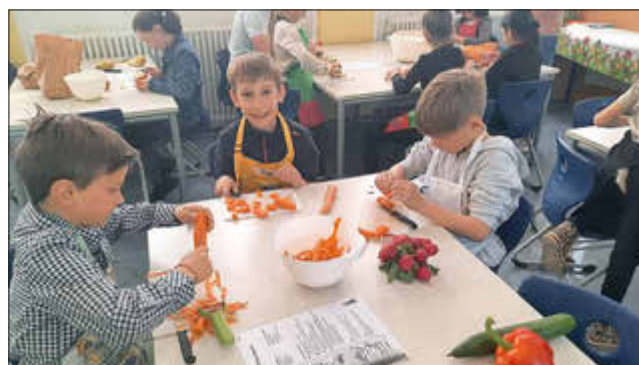
An allen Plätzen wird fleißig gearbeitet

Mit Feuereifer haben die Kinder Kartoffeln gewaschen, kleingeschnitten und mit Kräutersoße mariniert, Gemüse geputzt und kleingeschnitten, Möhren geraspelt, Bananen püriert, Brote bestrichen, Obst geschält und kleingeschnitten, Quark gerührt und Salatsoße gemixt.