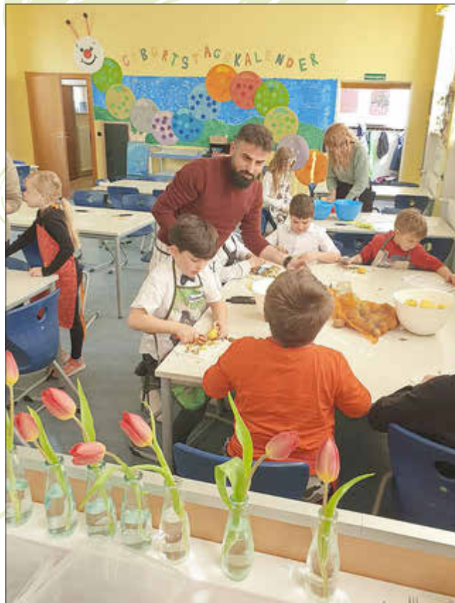
Auch Väter haben bei der Vorbereitung geholfen

Nach 5 Übungseinheiten haben die Schüler der beiden 2. Klassen der Grundschule Wallerfangen es geschafft: alle haben die Prüfung für den Ernährungsführerschein mit Bravour bestanden.