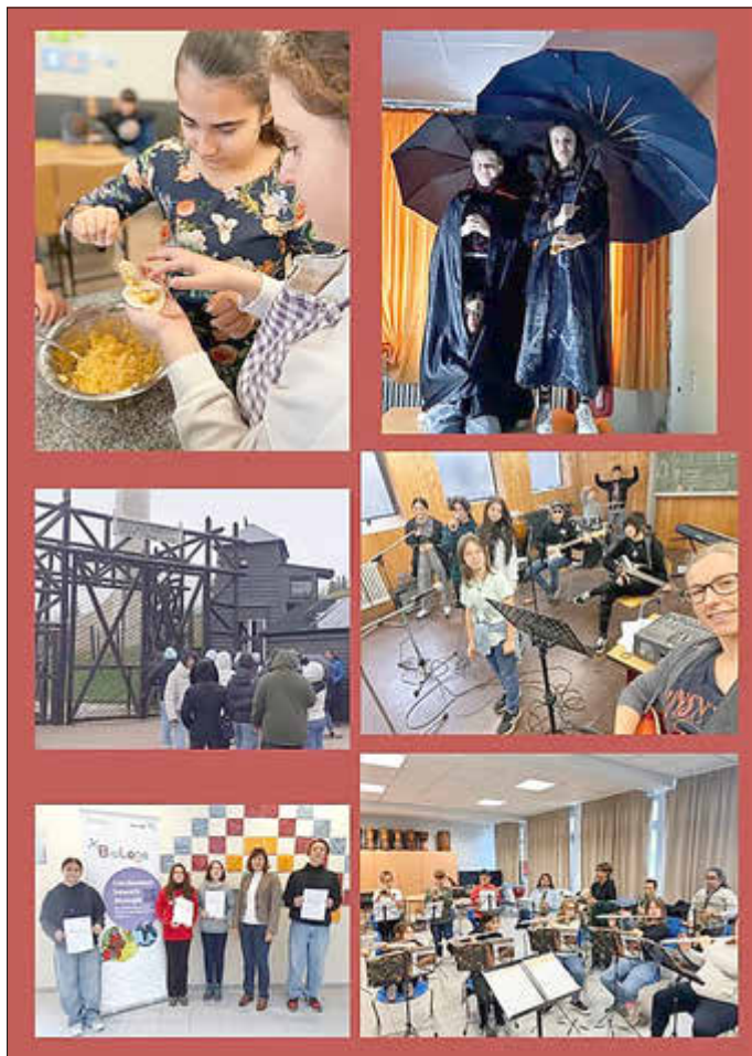
Erster war der Besuch des ehemaligen Konzentrationslagers Struthof unserer Klassenstufe 10 zu Beginn des Monats, wobei Geschichte hautnah erlebt werden konnte. Gefeierte wurde aber auch: Halloween Party