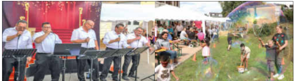
Impressionen Spätsommerfest am Haus der Generationen 2023

Mit den Amtlichen Bekanntmachungen der Gemeinde Wallerfangen