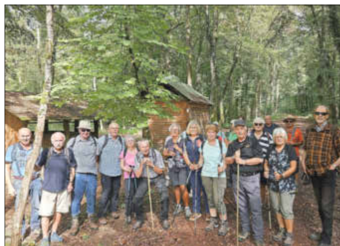
Auf dem Ferkelsweg