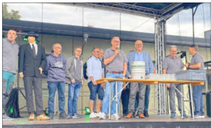
Eröffnung und Fassanstich