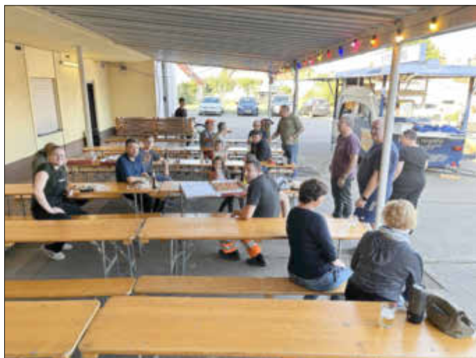
Stärkung nach dem Aufbau