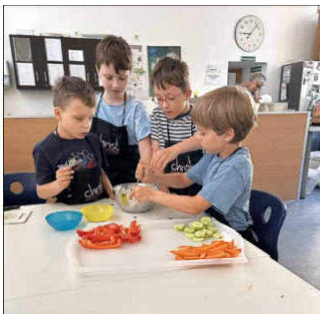
Gemeinsames Anrühren des Quarks- so wird er besonders cremig.