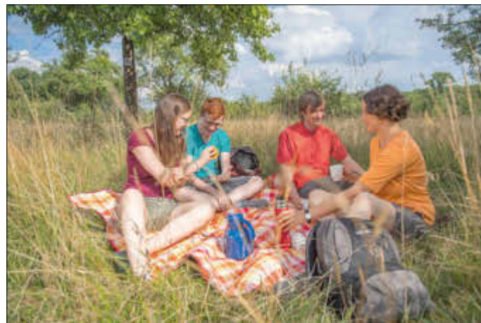
Die heimische Natur entdecken und sich mit Leckereien unserer regionalen Anbieter stärken: Das bietet wieder die beliebte Kulinarik-Wanderung im Landkreis Saarlouis, „Wieslein deck dich“

Treffpunkt: Sonntag, 23.07.2023, 9.00 Uhr, Wanderparkplatz „Der Gisinger“ (L352, 66798 Wallerfangen-Gisingen).