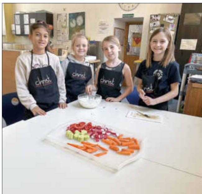
Stolz wird das Knabbergemüse präsentiert.