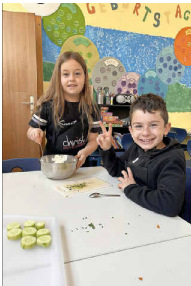
Der Quark scheint zu schmecken.