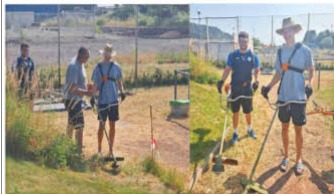
Arbeitseinsatz beim SV Wallerfangen:

die Blümchen blühen, die Tore sitzen und der Hang ist sauber