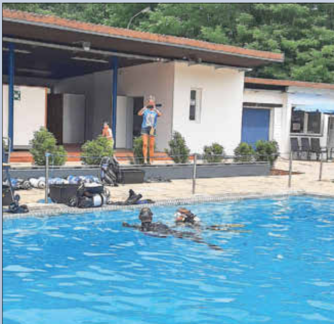
Schnuppertauchen im Sprungbecken