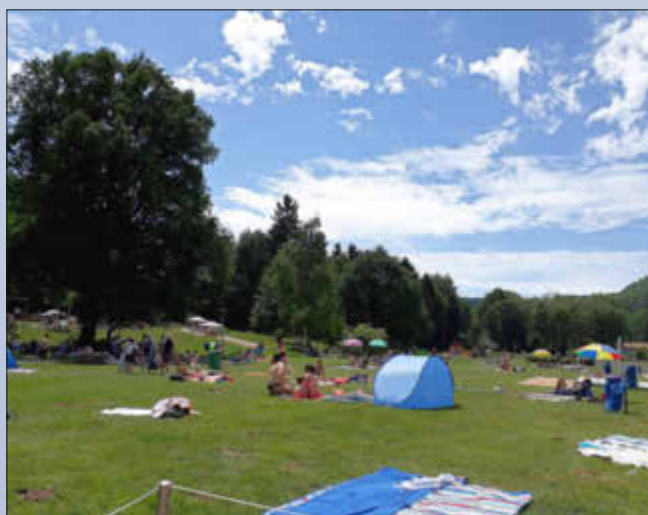
Idylle im Blauloch

Freibad Wallerfangen... mehr als schwimmen