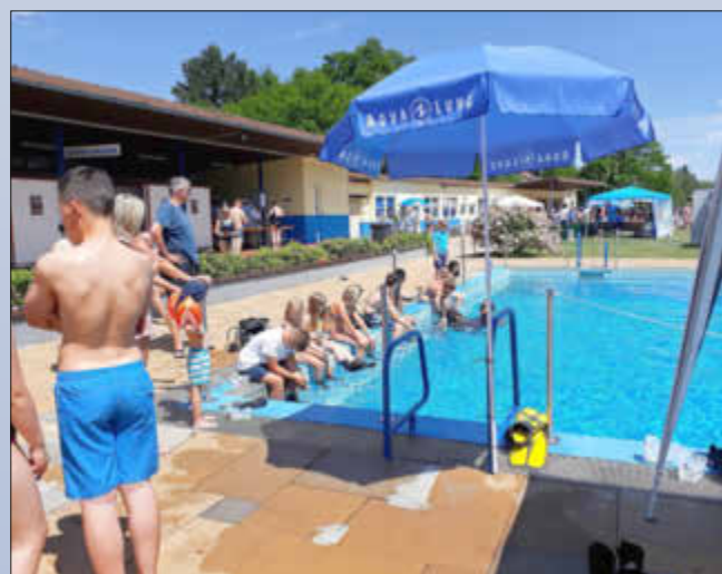
Schnuppertauchen bei „Familien in Bewegung“ 2017

Freibad Wallerfangen ... mehr als schwimmen