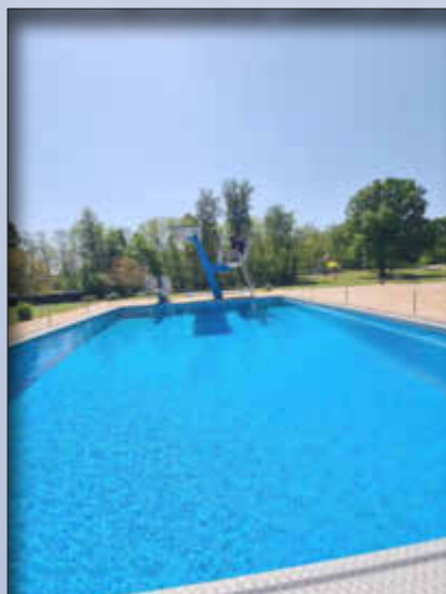
Das Sprungbecken mit dem neu nutzbaren Sprungturm

Freibad Wallerfangen..mehr als schwimmen