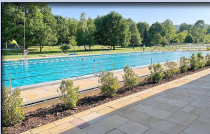
Der Betrieb ist noch verhalten - also Platz zum Schwimmen