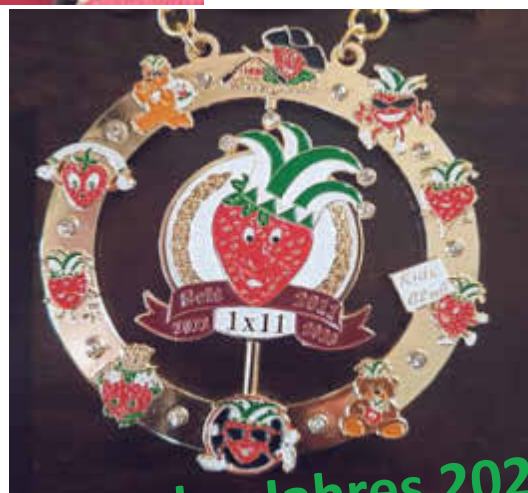
Orden des Jahres 2023