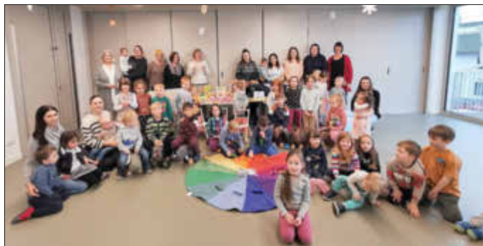
Alle Kinder, Erzieher/innen und der Vorstand des Fördervereins mit den Geschenken

Das Leuchten in den Augen der Kinder aber auch in der, der Erzieher war für uns als Förderverein das tollste Geschenk und die größte Motivation. Auch möchten wir uns bei den Gründern des Fördervereins für das Legen der Grundsteine und die Starthilfe herzlich bedanken.