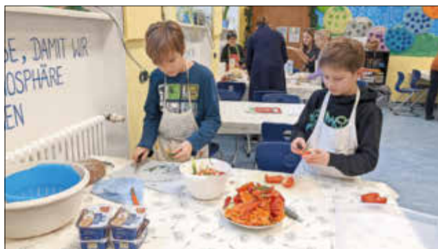
Vorbereitung der Brotgesichter-Deko

Mit Feuereifer haben die Kinder Kartoffeln geschält, Gemüse geputzt und kleingeschnitten, Möhren geraspelt, Bananen