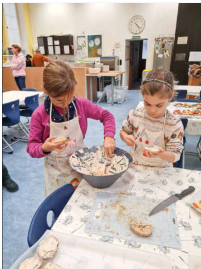
Die Brötchen werden mit Frischkäsecreme bestrichen

Mit Feuereifer haben die Kinder Kartoffeln geschält, Gemüse geputzt und kleingeschnitten, Möhren geraspelt, Bananen