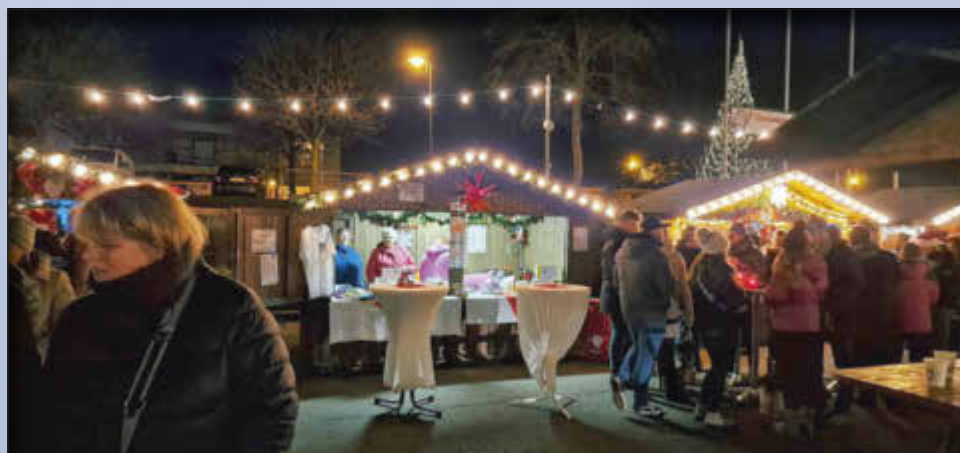
Freibad Wallerfangen.. mehr als schwimmen

Die Gewinne können abgeholt werden am 10., 11. und 18.12.22 zwischen 15.00 und 18.00 im Historischen Museum Wallerfangen. Alternativ können Sie mit Frau Dewald einen Termin vereinbaren unter 0160 6645579