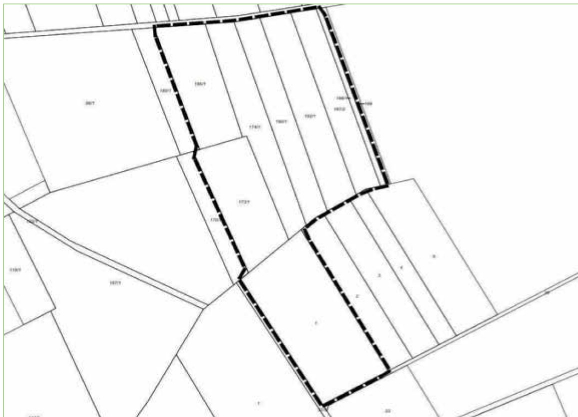
Abbildung: Geltungsbereich des Bebauungsplanes

Die genaue Abgrenzung des Geltungsbereiches ist der Planzeichnung zum Bebauungsplan und der folgenden Abbildung zu entnehmen. Der Geltungsbereich der FNP-Teiländerung ist mit dem Geltungsbereich des Bebauungsplanes identisch.