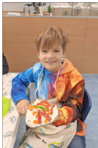
Das Werk wird stolz präsentiert

Die Kinder haben mit Feuereifer das Gemüse gewaschen und kleingeschnitten. Der Umgang mit Gemüseschälern und Messern klappte problemlos und unfallfrei. Mit Frischkäse, Gemüsestückchen und Schnittlauch entstanden tolle Kreationen, die von den Kindern anschließend mit Appetit verspeist wurden.