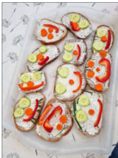
Kleine Auswahl an Brotgesichtern

Die erste Unterrichtseinheit hat sich mit dem Thema Brot beschäftigt. Nach dem Test von 3 unterschiedlichen Brotsorten (Roggenbrot, Mehrkornbrot und Vollkorn-Mischbrot) auf Aussehen, Geruch und Geschmack haben die Kinder sehr phantasievolle Brotgesichter angefertigt.