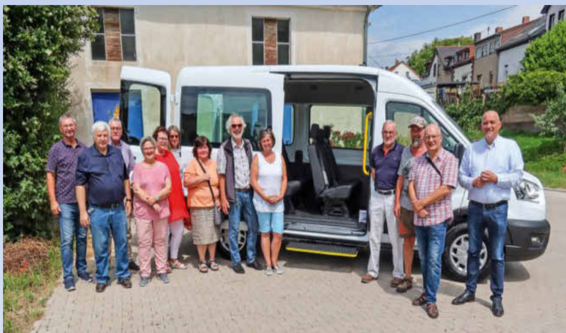
Der Bus mit seinen ehrenamtlichen Fahrern und Helfern.

Weitere Informationen: finden Sie auf der Homepage der Gemeinde Wallerfangen: www.wallerfangen.de/Leben/Buergerbus und immer wieder im Amtsblatt.