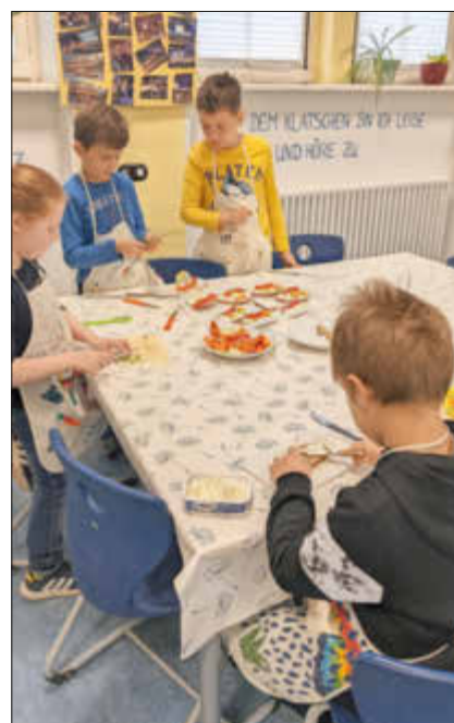
Alle sind mit Eifer dabei

Wir bedanken uns bei der Bäckerei Welling für die Brotpenden.