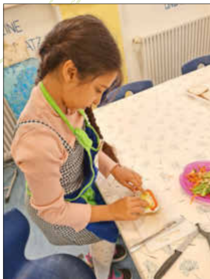
Sorgfältige Dekoration der Brot-scheibe

Die Kinder lernen bei diesem Projekt in 10 Doppelstunden die Grundlagen gesunder Ernährung in Theorie und Praxis kennen. Die Kinder bereiten selbst verschiedene Gerichte zu, erfahren dabei auch, wie Lebensmittel vorbereitet werden und wie man die Gerichte ansprechend anrichtet. Auch das Aufräumen und Spülen gehört zu dem Kurs dazu.