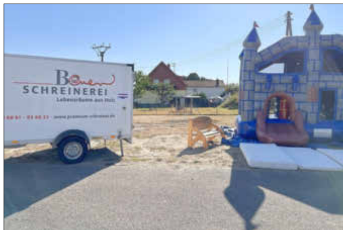
Dank für die Unterstützung