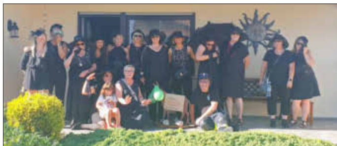
Auch der Hansenberger Esel ist mal „verhindert“