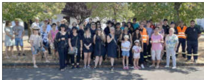
Startklar zum Umzug