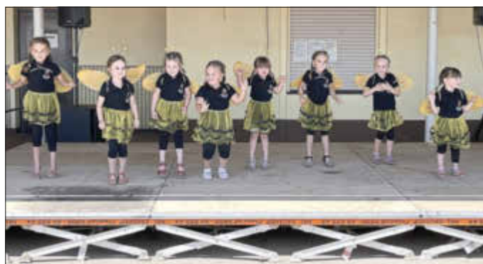
Die kleinen Bienen der Erdbeernarren