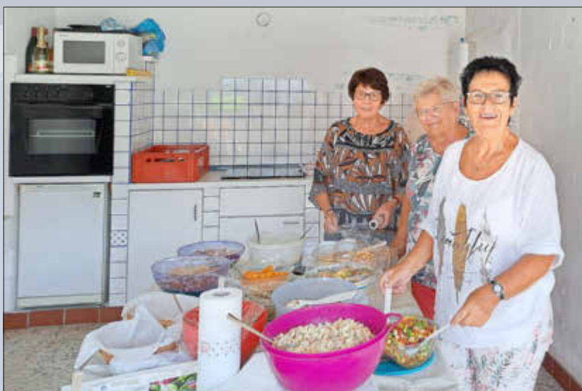
Das Salatbuffet wird aufgebaut

Der Erlös des Kalenderverkaufs kommt voll und ganz dem Freibad zugute! Freibad Wallerfangen...mehr als schwimmen