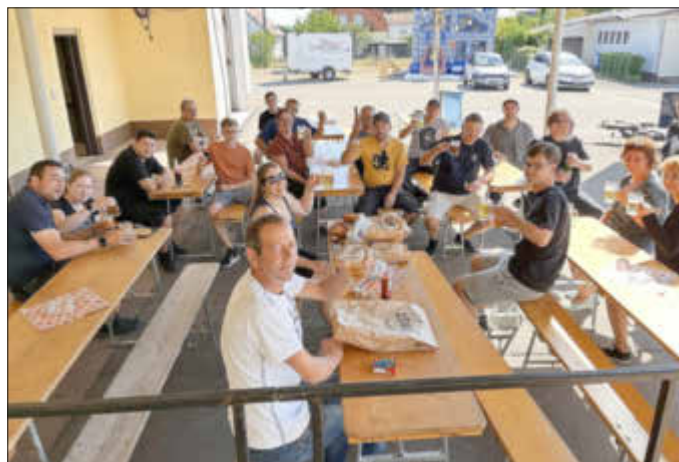
Viele fleißige Hände beim Aufbau