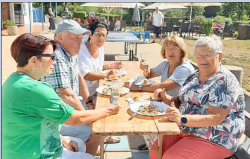
Der Salat schmeckt!