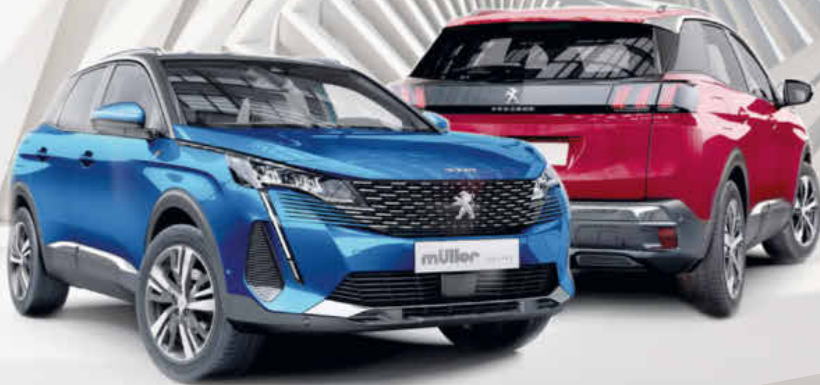
Abbildung zeigt aufpreispflichtiges Zubehör.