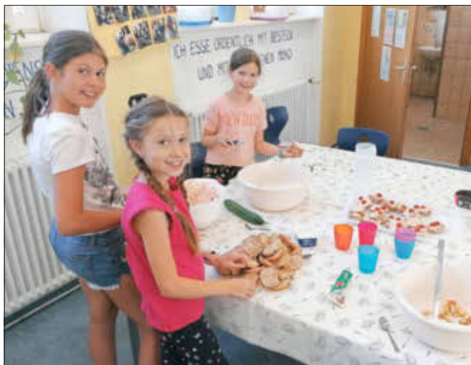
Die fleißigen Brötchenschmiererinnen