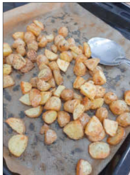
Highlight knusprige Backofenkartoffeln