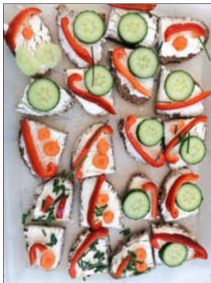
schön dekorierte Brotgesichter