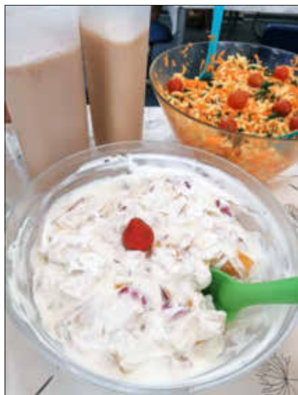
Nudelsalat, Früchtequark, Bananenmilch