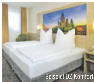
Beispiel DZ Komfort

DZ STD = Doppelzimmer Standard DZ KOM = Doppelzimmer Komfort Einzelzimmerzuschlag Saison 1: 15 €/N. Saison 2+3: 33 €/Nacht Kurtaxe: ca. 0,50 € pro Person/Nacht Auch 5 Nächte buchbar!