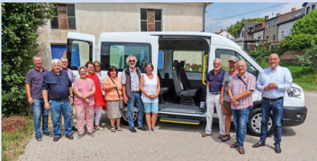
Der Bus mit seinen ehrenamtlichen Fahrern und Helfern.

Weitere Informationen: finden Sie auf der Homepage der Gemeinde Wallerfangen: www.wallerfangen.de/Leben/Buergerbus und immer wieder im Amtsblatt.