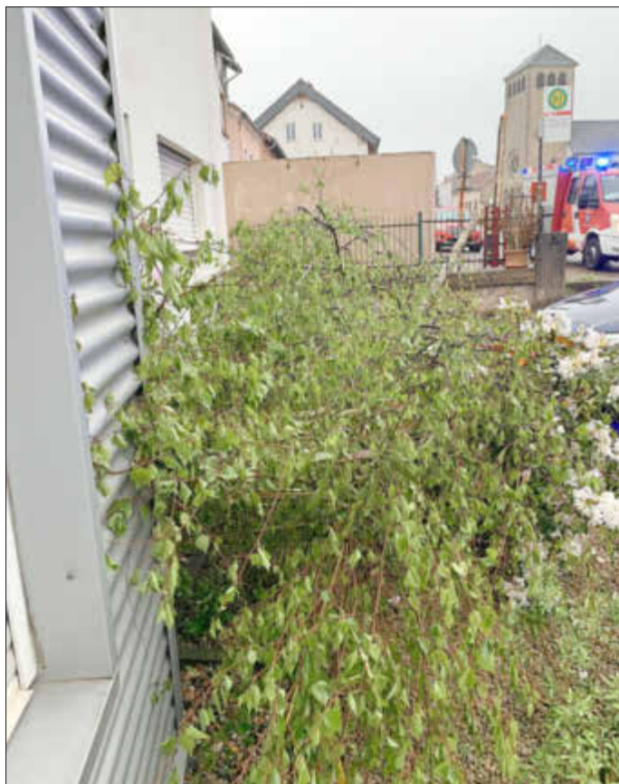
Nur mit viel Glück geringer Sachschaden