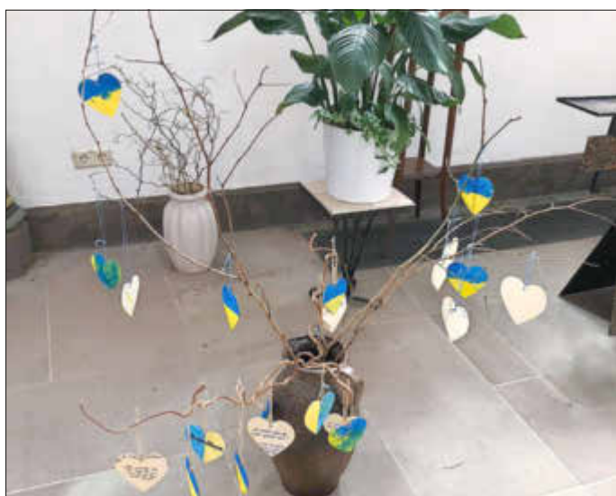
Die Kinder der Kath. Kindertageseinrichtung St. Katharina Wallerfangen malen Herzen für die Ukraine und stellen diese in der katholischen Kirche aus.

Auch bei den Kindern unserer Kindertageseinrichtung wurde die vergangenen Tage die Lage in der Ukraine zum Gesprächsthema, als wir auf dem Weg zu einem Kirchenbesuch unterwegs waren.