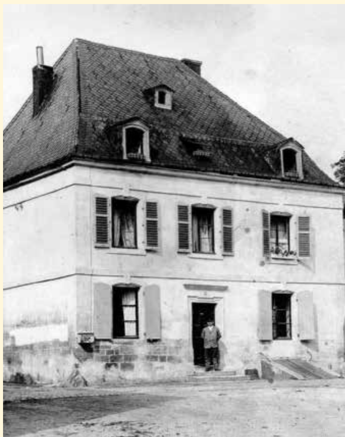
Text: Rainer Darimont, Foto: Archiv Heimatmuseum, Bildtechnik Klaus Eisenbarth

Die begann 1959 mit einer großen Idee, verblüffte 1961 mit ihrer baulichen Umsetzung und geriet dann, wie so vieles Großes, wieder in Vergessenheit. Die Bevölkerung hat bislang kaum Kenntnis davon erhalten, in welchem architektonischen Juwel die Amtsgeschäfte der Gemeinde Wallerfangen seit 1961 bis heute abgewickelt werden (siehe Historische Seite, 10.KW2022, Seite 9).