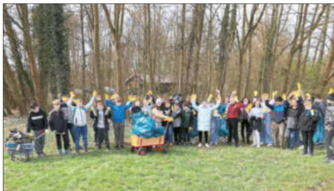
Die Klassenstufe 6 nach getaner Arbeit.

Bei gutem Wetter und spannenden Funden hat es der Klassenstufe 6 auf alle Fälle Spaß gemacht!