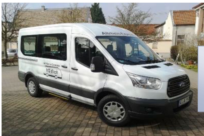
Beispiel eines Bürgerbusses