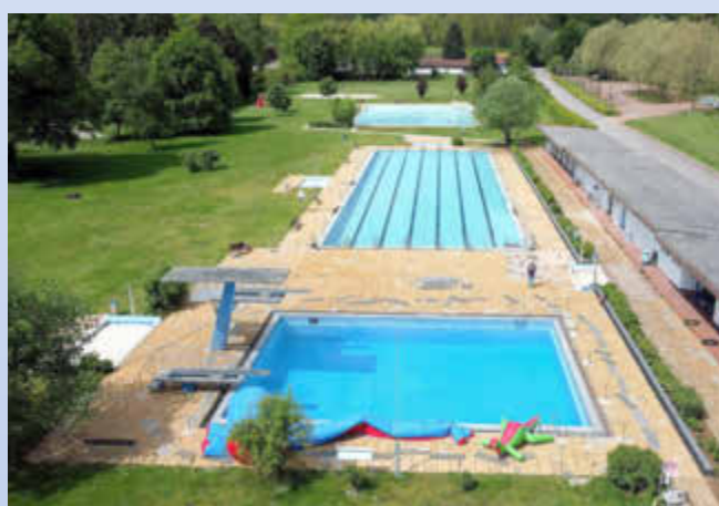
Sooo viel Platz hat man im Wallerfanger Freibad