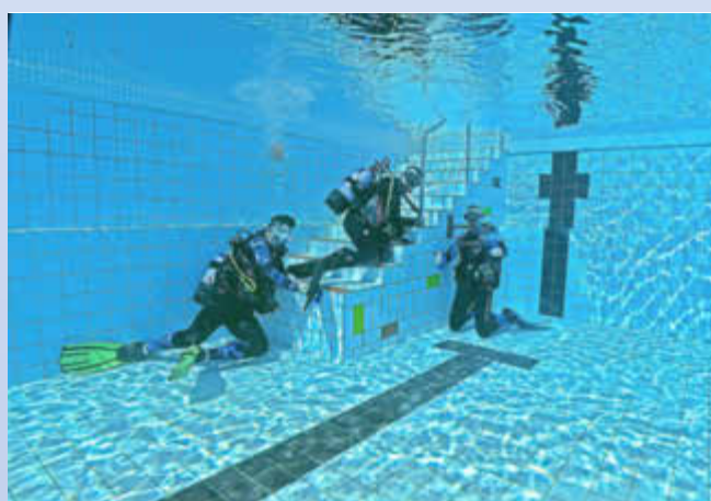
Alternative Form der Beckenreinigung: die Taucher vom Abenteuertuchen Perl