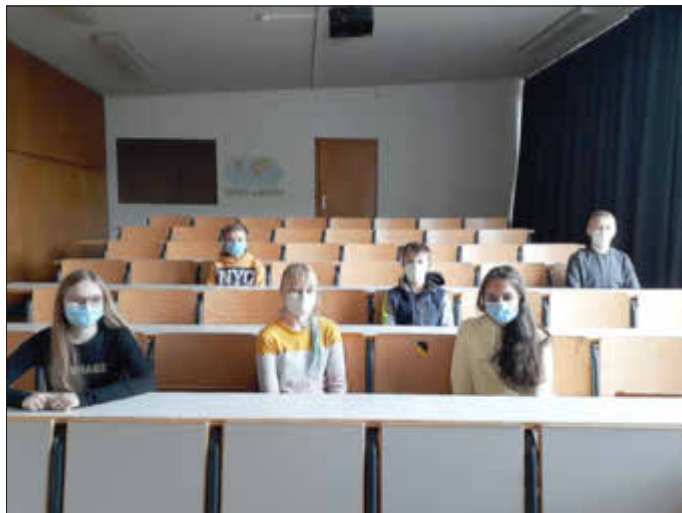
Einige der erfolgreichen Mathematiker/innen des SGS

SGS als einziges saarländisches Gymnasium beim ungarischen Bolyai-Wettbewerb dabei!