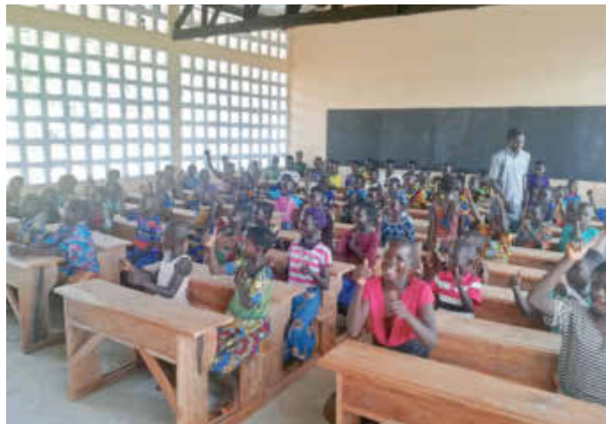
Schule und Klassenzimmer nach Fertigstellung Oktober 2021