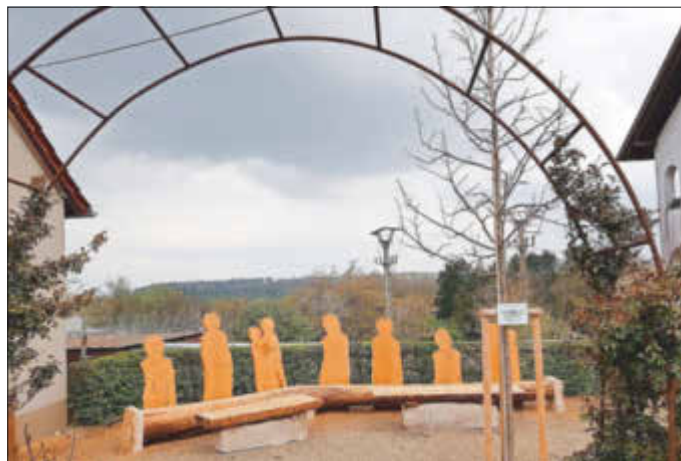
originelle Ruhebank an der Traumschleife „Der Gising“