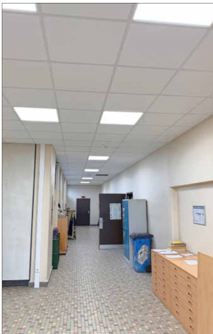
Flurbereich mit neuer Decke und Beleuchtung