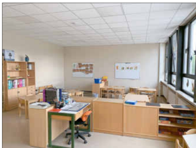
Grosser Saal 2