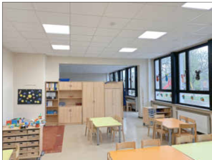
Grosser Saal 1