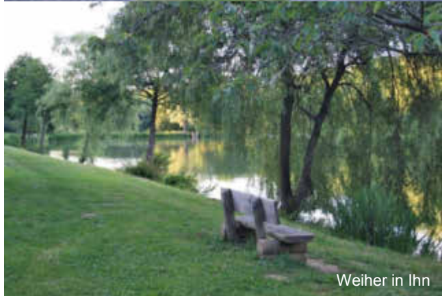
Weiher in Ihn