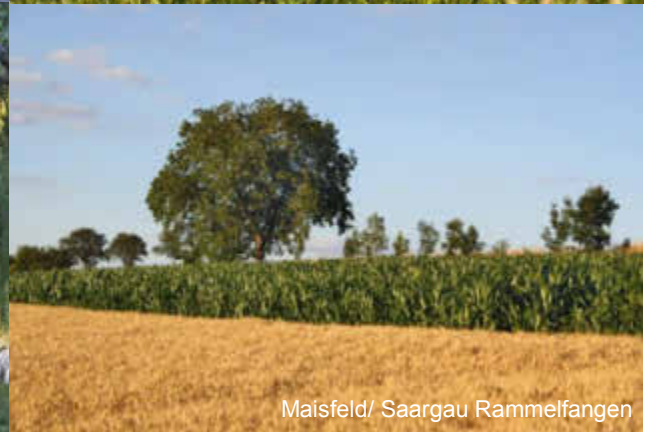
Maisfeld/ Saargau Rammelfangen