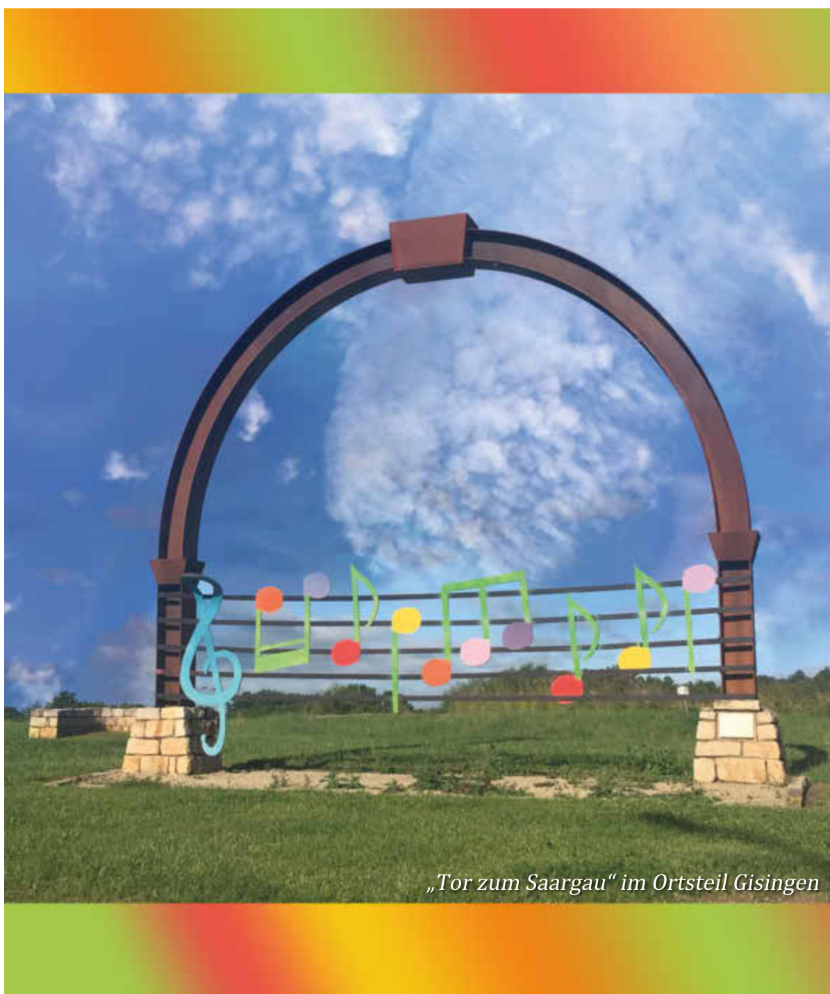
„Tor zum Saargau“ im Ortsteil Gisingen

Mit den Amtlichen Bekanntmachungen der Gemeinde Wallerfangen