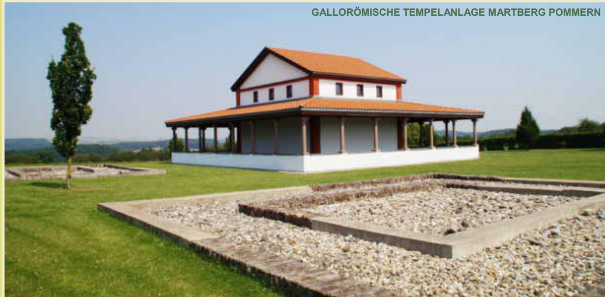
GALLORÖMISCHE TEMPELANLAGE MARTBERG POMMERN