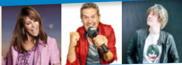
Ireen Sheer, Peter Wackel und Mickie Krause