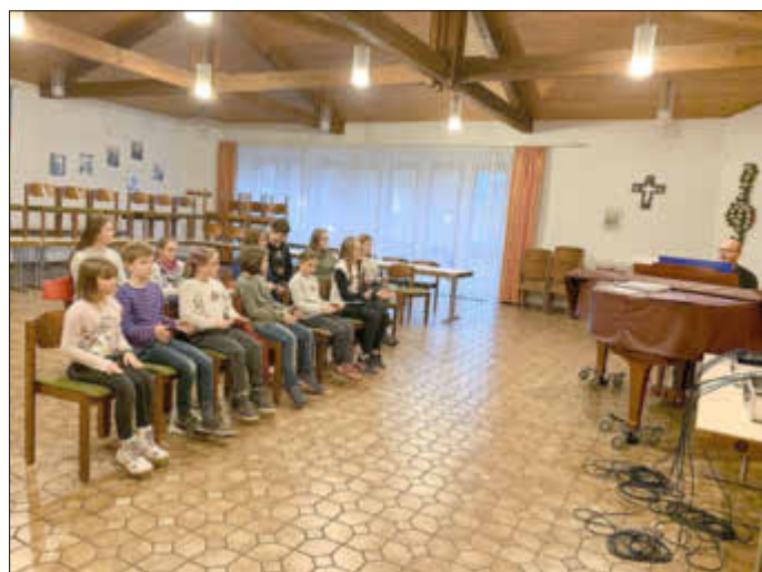
Chorprobe beim Kinder- und Jugendchor St. Katharina

„Kids und Hits 2019“ lautet das Motto, unter dem das Konzert des Kinder- und Jugendchor St. Katharina Wallerfangen in diesem Jahr steht. Nach den großen Erfolgen der Musical-Aufführungen der letzten Jahre präsentiert der Chor diesmal Hits aus den Charts von heute und den vergangenen Jahren ebenso wie aus bekannten Musicals und Filmen. Der abwechslungsreiche Mix von „Like I love you“ über „Wozu sind Kriege da?“ bis hin zu „Probiert mal mit Gemütlichkeit“ verspricht heute schon gute Unterhaltung für Jung und Alt. Unterstützt wird der Chor auch diesmal von einer eigens für dieses Ereignis zusammengestellten Band. Erleben Sie