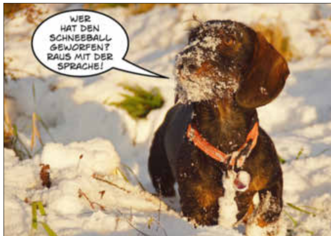
Kalenderblatt des Monats Februar

Sie wollen die ASG-Schulhunde einmal auf andere Weise sehen? Dann ist unser ASG-Schulhunde-Kalender 2020 genau das Richtige für Sie. Im DIN-A-4-Format haben wir, die Gesellschafter der Schülerfirma 96 Pfoten, für Sie wunderschöne Fotos unserer Schulhunde ausgewählt und mit witzigen Sprechblasen versehen.