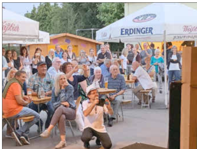
In freudiger Erwartung