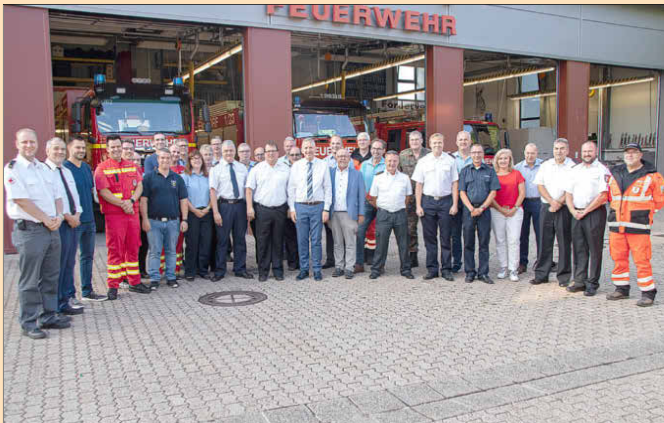
Ein Jahr Planung liegt hinter den Planern der großen Katastrophenschutzübung am 31. August im Landkreis Saarlouis.

Der Landkreis Saarlouis hat für Fragen rund um die Übung ein Bürgertelefon eingerichtet. Dieses ist erreichbar unter: 06831/ 444-6655