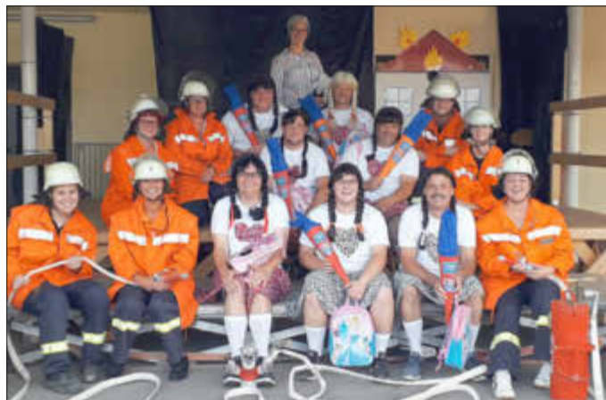
Hurra hurra die Schule brennt mit den Erdbeernarren und der LG St. Barbara