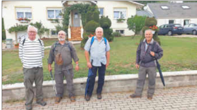
Alle Teilnehmer Richtung Remelfangen 24 km