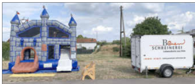
Unser Sponsor der Hüpfburg