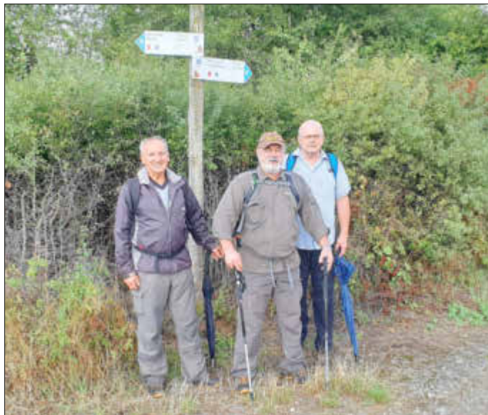
Wallfahrt nach Remelfangen und Neue Beschilderung vom Saarlandrundwanderweg