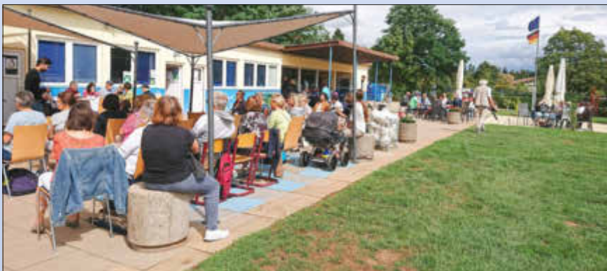
Zahlreiche Konzertbesucher genießen die besondere Atmosphäre im Freibad