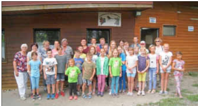
Tschernobyl-Kinder mit Betreuerinnen und Gasteltern

Der Vorstand der Saarländischen Kinderhilfe – Leben nach Tschernobyl e.V.