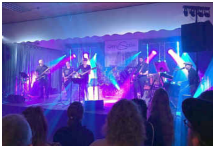
Grenzstein am Rocken