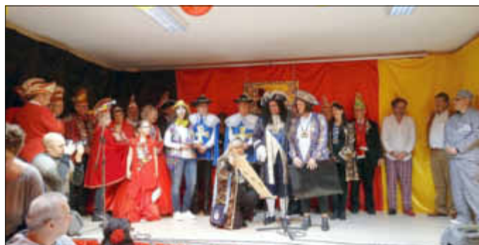
Aufmarsch der Vereine, Prinzenpaare, Sonnenkönig, Ortsvorsteher, Bürgermeister

Loschdich on scheen woret, so soll et sen, drom laden mir eich schon fot nächschde Joar en. Ob Wellness, Samba oda König, es fo us gar net gewöhnlich. Mem Sonnekönich of da Bühn se stehn, dat wor jo mol gud ansehehn. Von Klubb3 bes zur Tänzerei, et wor fo jeden wat dabei. Alle Hopp.