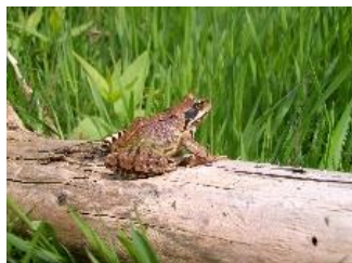
Foto: © Ein Grasfrosch im Naturpark Saar-Hunsrück/Sascha Schleich

der Strecke gibt Sascha Schleich Einblicke in das Leben der Amphibien und informiert über Gefährdungsfaktoren und Schutzmöglichkeiten. Veranstalter sind der Naturpark Saar-Hunsrück in Kooperation mit dem GNOR Arbeitskreis Nahetal und der Naturpark-Verbandsgemeinde Thalfang am Erbeskopf. Der Treffpunkt wird bei der Anmeldung bekanntgegeben. Die Teilnahme ist kostenlos. Empfohlen sind witterungsfeste Kleidung und festes Schuhwerk. Die Teilnehmerzahl ist begrenzt. Eine frühzeitige Anmeldung ist bei der Naturpark-Geschäftsstelle in Hermeskeil, Telefon 06503/9214-0, erforderlich.