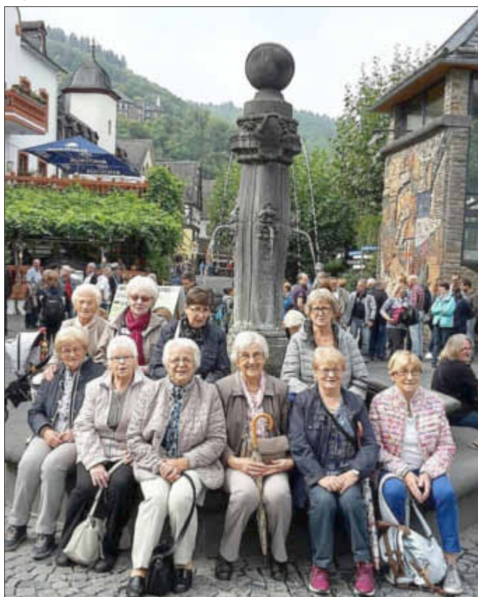
Ein Erinnerungsfoto von unserer schönen Tagesfahrt vom 23.09.2017 nach Cochem an der Mosel.