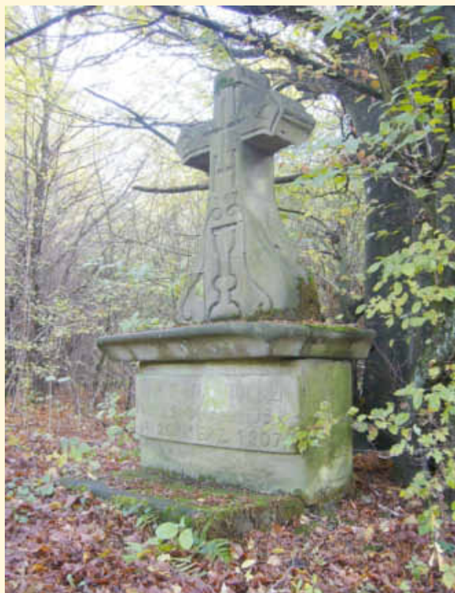
War hier der Ausdruck einer höheren Macht im Spiel?

Das Wegekrenz wurde 1807 außerhalb des Ortes aufgestellt, in romantischer Lage, im Schatten dichter und im Halbkreis stehender Bäume. Obwohl es nur einige Meter neben dem Weg steht, bemerkt der Wanderer das dunkel stehende Steinkrenz nur, wenn er danach sucht. Es besteht aus einem Sockel in Form eines einfach profilierten Kastenaltars und einem Kruzifix mit bemerkenswerter Basis. Diese ist breit und flaschenförmig und erhebt sich formschön von der Abdeckplatte zum Balkenkrenz. Das Krenz zeigt unter der Jahreszahl 1807 nur einen großflächigen Kelch, eingerahmt von zwei schwungvollen Voluten. Die Kreuzbalken sind mit „liegenden“ Herzen geschmückt. Die Verzierungen wirken in ihrer einfachen Optik klar, schnörkellos und sind wie von Kinderhand gefertigt. Der besondere Reiz des Kreuzes besteht in seinen Proportionen, mit einer Ausdrucksform, die, neben dem breiten Fuß, von einer plastischen Tiefe gekennzeichnet ist. Diese betont kräftige Gestalt verleiht dem Krenz eine gewisse statische Ruhe, die sich wohltuend auf das Auge des Betrachters auswirkt.