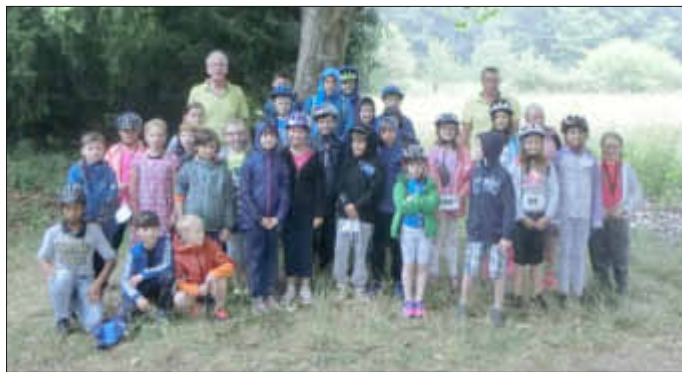
Trotz des am Wettkampftag sehr regnerischen Wetters in allerbesten Laune präsentierte sich die erfolgreiche Wallerfanger Triathlondelegation dem Fotografen.