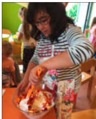
Die Früchte werden unter den Quark gerührt