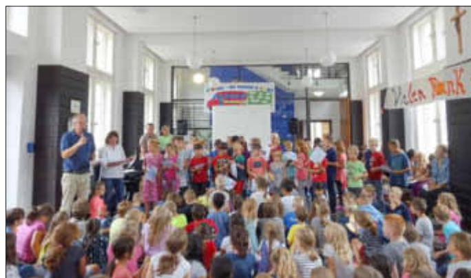
Ehrung der erfolgreichen Triathletenmannschaft