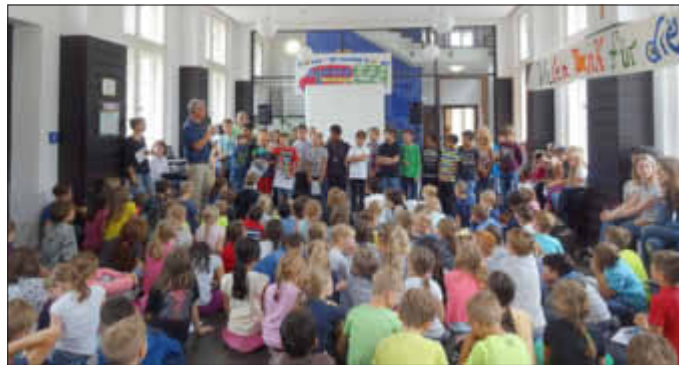
Die Fußballer erreichten in diesem Jahr bei den Schulmeisterschaften die zweite Runde und wurden ebenfalls geehrt

Klasse 4.1 und 4.2 Grundschule Altes Rathaus Wallerfangen