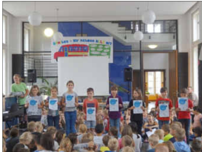
Die Mediatoren für das kommende Schuljahr