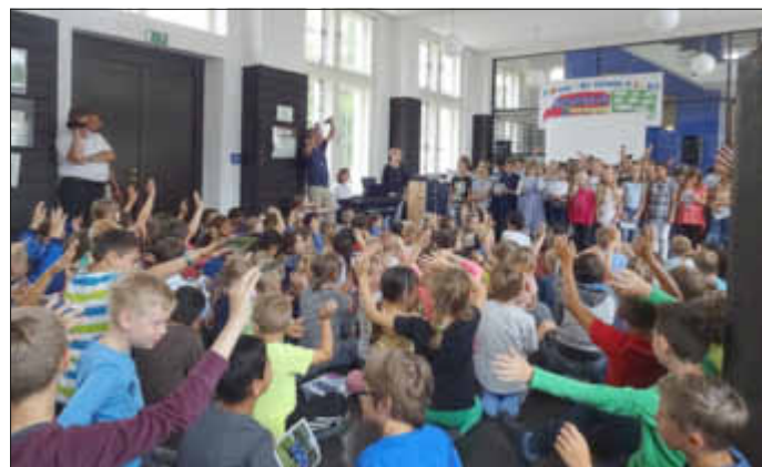
„Zeit zu gehen“