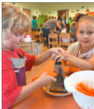
Beim Raspeln der Möhren für den Nudelsalat