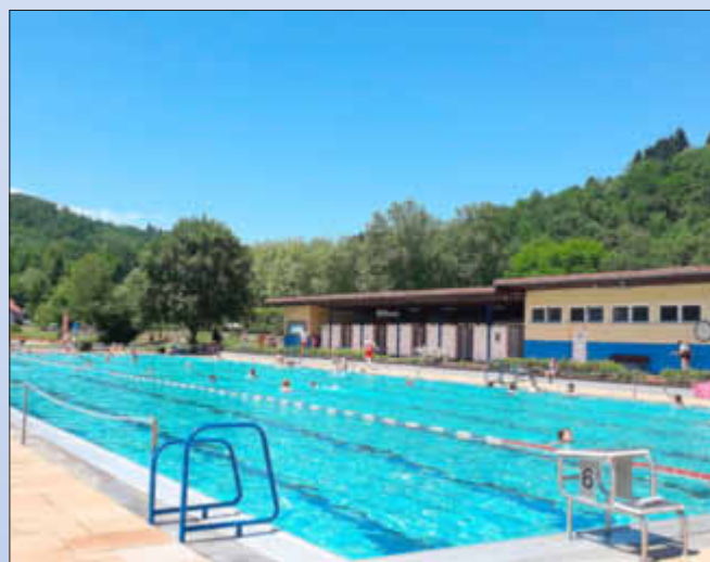
Das 50 Meter-Becken bietet viel Platz zum Schwimmen