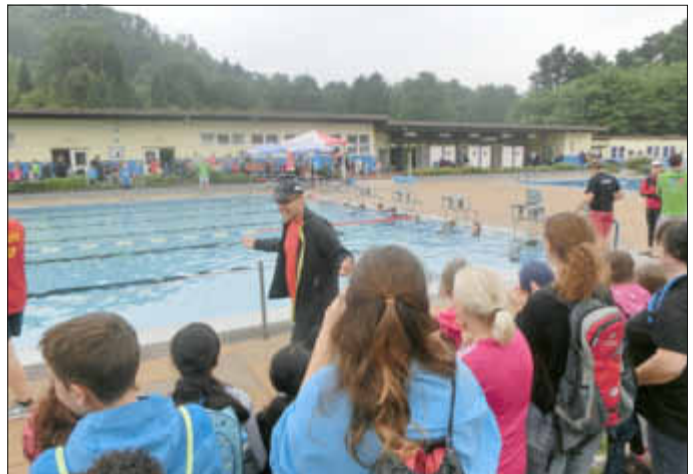
Über 100 Wallerfanger Grundschüler sorgten für eine stimmungsgewaltige Unterstützung, hier beim Start zum 50 m Schwimmen der ersten Jungengruppe des Jahrgangs 06/07.