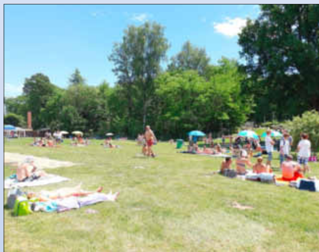
Ein kleines Plätzchen findet sich immer noch auf der Liegewiese