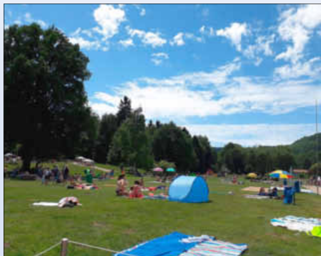
Umgeben von einer herrlichen Landschaft