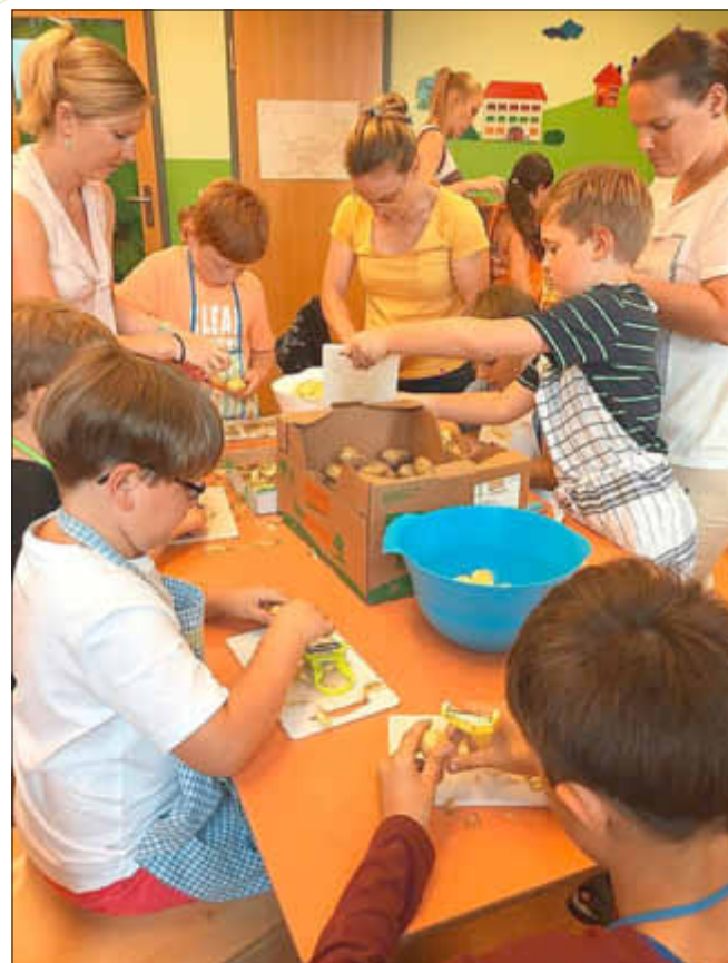
Ein großer Berg Kartoffeln musste geschält werden