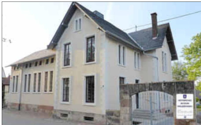
Den neuen Eingang des Museums erreicht man durch den Torbogen

Was lange währt, wird endlich gut: Am Freitag, dem 18. September um 18 Uhr wird das bisherige Heimatmuseum in einem Festakt in der Aula der Grundschule Wallerfangen auf der Adolphshöhe wieder eröffnet, nun aber in veränderter Gestalt und unter neuem Namen: Historisches Museum Wallerfangen .