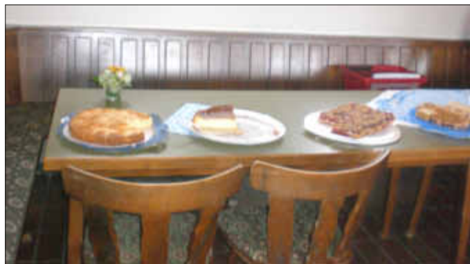
Leckerer selbstgebackener Kuchen

Die Tanzgruppen „Hansenberger Beerenklauer“ und die „Erdbeerqueens“ haben sich keine Sommerpause gegönnt und schon fleißig ihren neuen Tanz einstudiert.