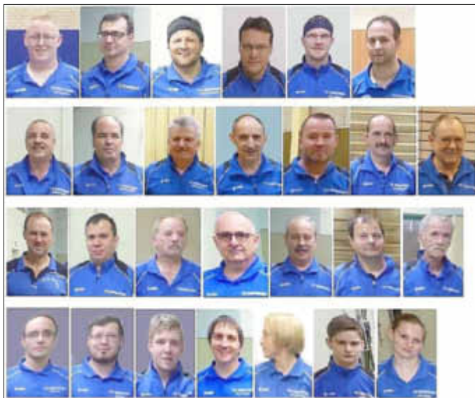
Von oben nach unten: Spieler der 1., 2., 3. und 4. Mannschaft des TTC Wallerfangen

Mehr über den Verein und seinen Aktivitäten erfahren Sie unter: www.ttc-wallerfangen.de