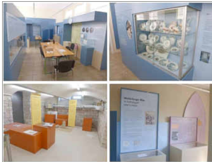
Einige Eindrücke der noch unfertigen Ausstellungsräume

chen; Dr. Winter wird in seinem Vortrag die Konzeption des Museums vorstellen. Für musikalische Atmosphäre sorgt Herry Schmitt. Anschließend werden die Besucher Gelegenheit haben, sich einen ersten Eindruck von der Ausstellung zu verschaffen. Für die Öffentlichkeit wird das Museum am Sonntag, dem 20. September zum ersten Mal geöffnet sein. Text: Friedel Jacob