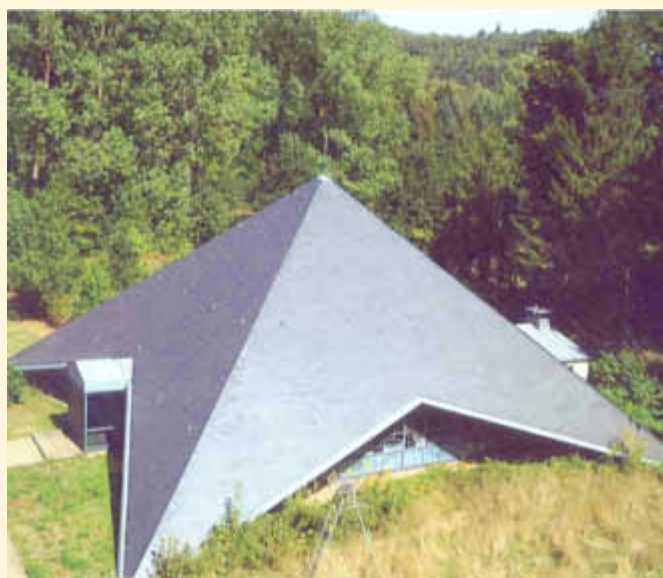
Glaube und Ausdruck in der Architektur - die Kapelle St. Michael