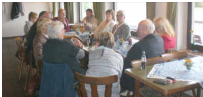
Beim gemütlichen, monatlichen Stammtisch

Wir bieten beim Stammtisch für unsere Gäste leckeren selbstgemachten Kuchen und Kaffee ab 15:00 Uhr an. Jeder der vorbei kommen will, ist herzlich willkommen. Man kann sich bei diesen Treffen über den Verein informieren und sich ein Bild von unserem Vereinsleben machen. Nächster Stammtisch ist am 04. Oktober (schon mal vormerken).