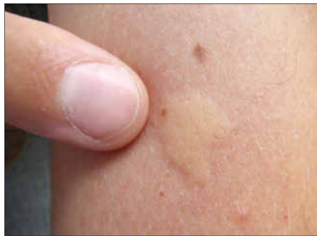
Quaddelbildung nach Stich

Noch besser ist bei diesen Fällen eine sogenannte Desensibilisierungsbehandlung im Vorfeld.