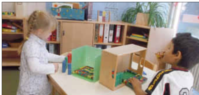
...und freies Spielen!