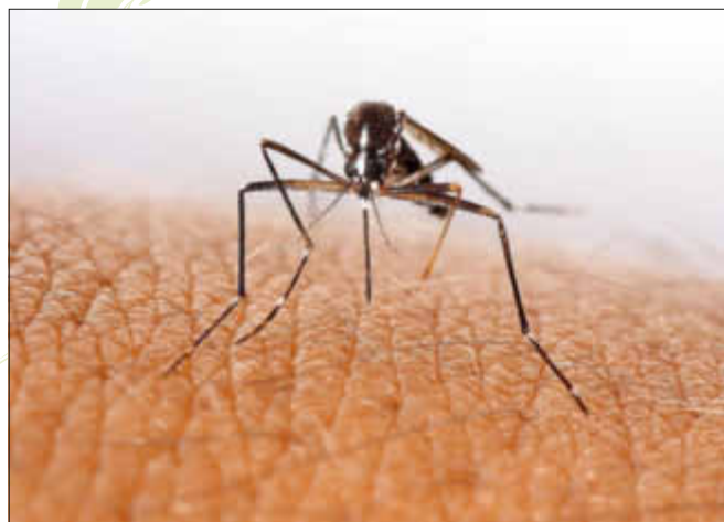
Kurz vor dem Angriff

Teilweise jucken die Stiche noch längere Zeit und bringen sich immer wieder in Erinnerung.