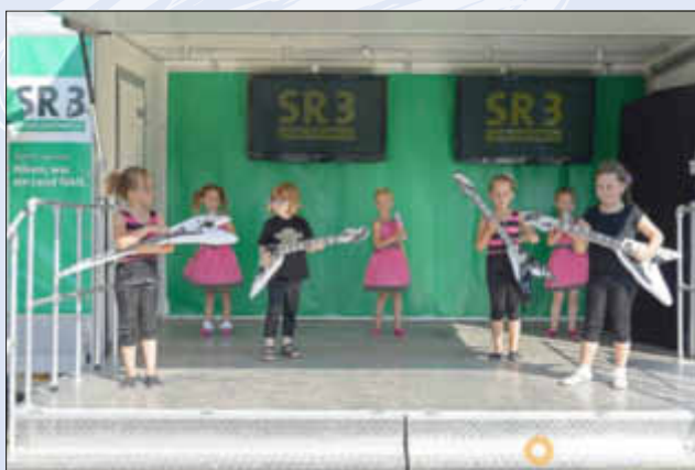
Die Kinder-Tanzgruppe der Erdbeernarren

Am letzten Freitag war der SR wieder mit einer Sendung in Wallerfangen vertreten. Diesmal war es der Rundfunk (SR 3), der aus dem Freibad berichtete. Anlass war das Engagement des Fördervereins für das Freibad.