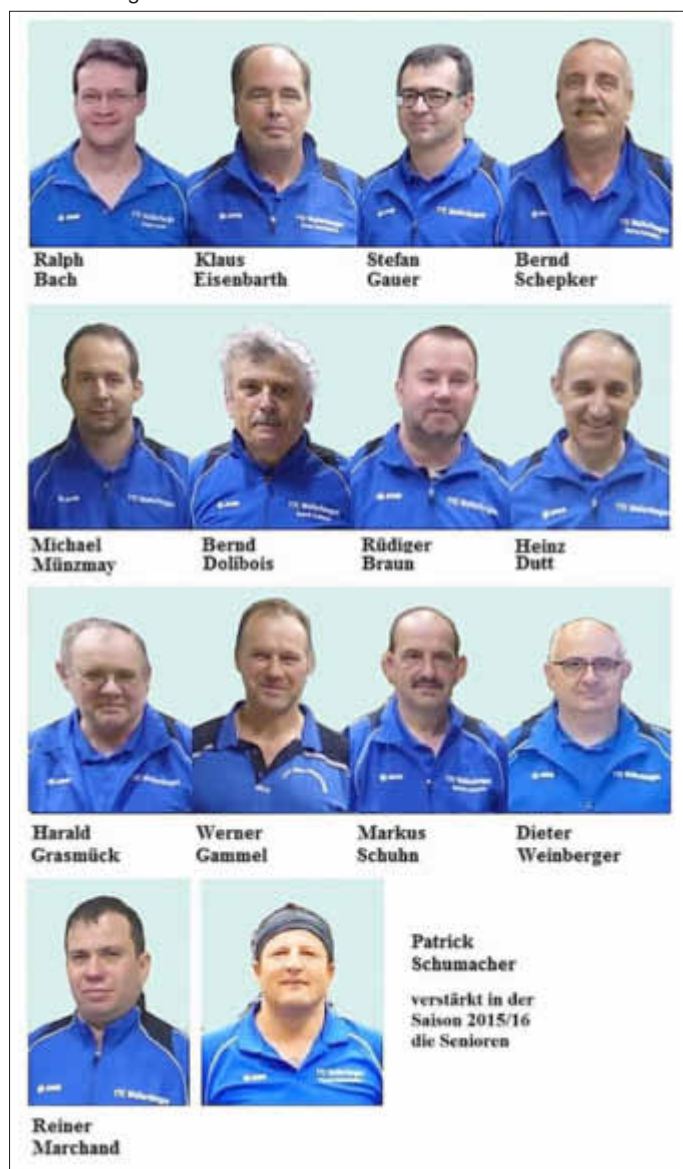
Die 1. Senioren des TTC Wallerfangen

Mehr über den Verein und seinen Aktivitäten erfahren Sie unter: www.ttc-wallerfangen.de