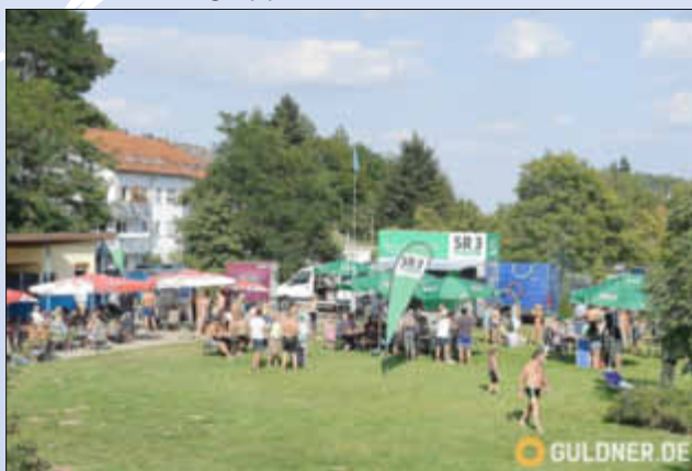
Richtig viel los auf der Wiese vor dem Bistro!