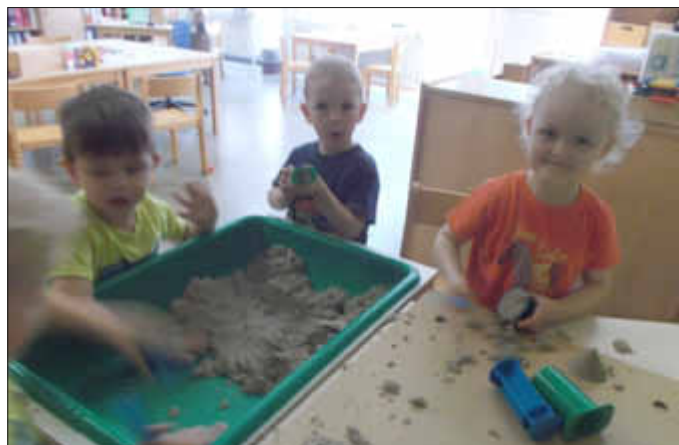
Die beliebte Sand-Ecke...