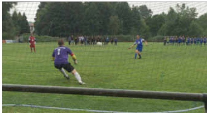
„Super - Holli „ in Aktion

Durch ein Eigentor konnten wir erneut in Führung gehen, unmittelbar vor dem Abpfiff erzielte Düren-Bedersdorf jedoch den Ausgleich, so dass die Entscheidung im Elfmeter-Schießen fallen musste.