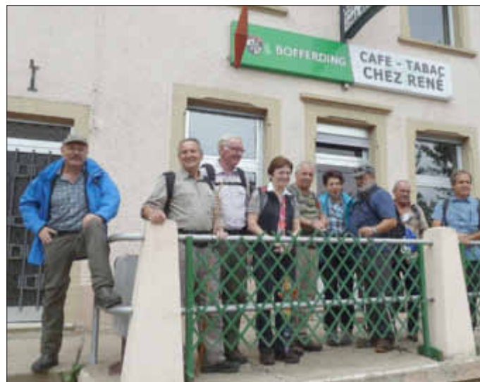
Zwischenrast in Oberdorff bei Rene

2. Am Sonntag, den 16. August 2015, fand die Pilgerwanderung von Wallerfangen ins lothringische Remelfang statt. Der 24 km lange Streckenweg erinnert an die vor 63 Jahren ins Leben gerufene Wallfahrt. In diesem Jahr machten sich 21 Wanderer auf den Weg.