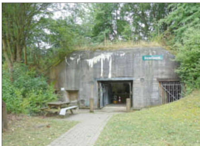
Bunkermuseum in Bad Bergzabern

1. Am Samstag, den 15. August 2015, führte Willibald Caspar eine Wanderung auf den Spuren des Westwalls in Bad Bergzabern. Start war am Bunkermuseum,