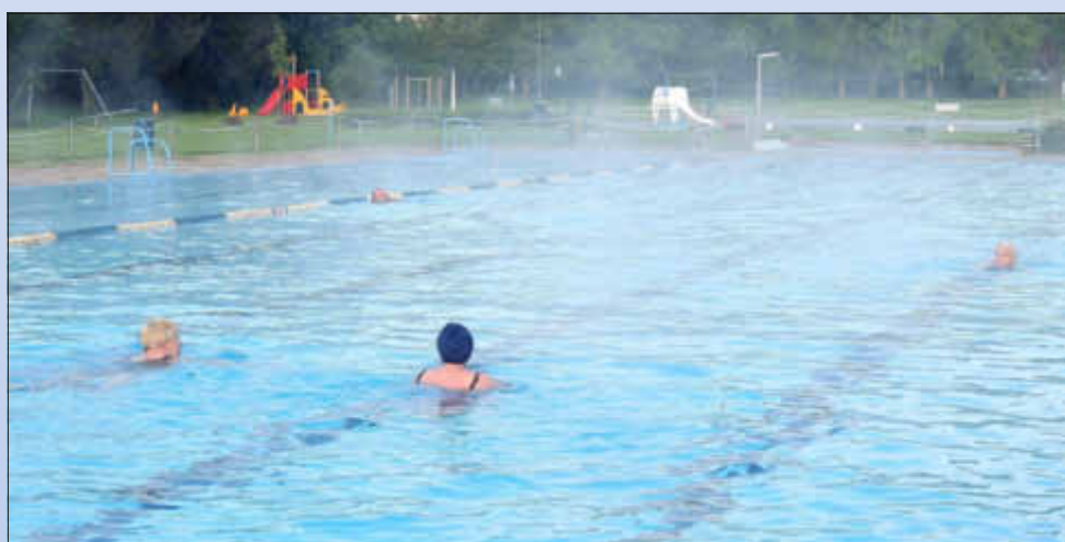
Auch bei Morgennebel macht das Schwimmen Spaß