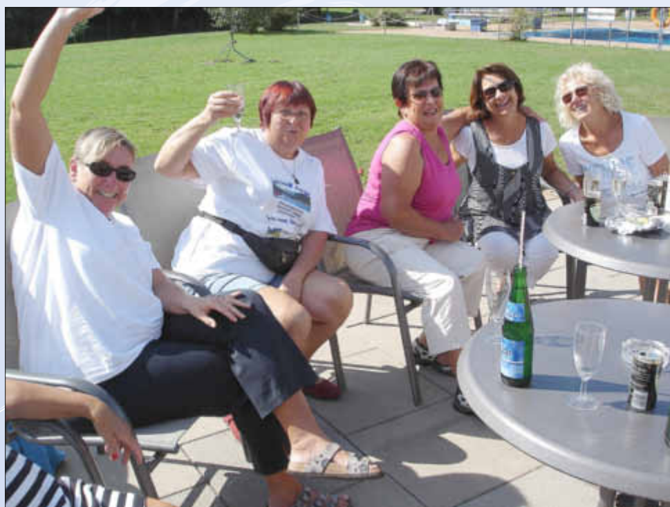
So fröhlich schwimmt man im Wallerfanger Freibad

am Freitag, den 21. August zwischen 16.00 und 18.00 Uhr