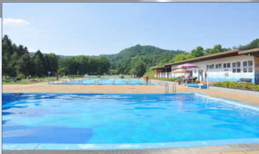
Das Wallerfanger Freibad lädt zum Schwimmen, Springen und zum Aquajogging ein

Neben Schwimmen, Springen und Tauchen lassen sich im Schwimmbad noch diverse andere Sportarten ausüben. Besonders interessant für viele Menschen sind Bewegungsformen im Wasser, die unter dem Begriff „Aquafitness“ zusammengefasst werden können: die klassische Wassergymnastik, Aquajogging und Aquacycling.