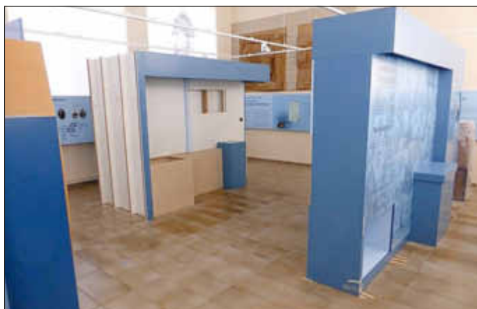
Im Schulsaal sind die Schreinerarbeiten schon voll im Gange

Der Termin rückt rapide näher: Am 18. September findet, wie angekündigt, in der Aula der Grundschule auf der Adolphshöhe der Festakt zur Eröffnung des neugestalteten Historischen Museums Wallerfangen statt.