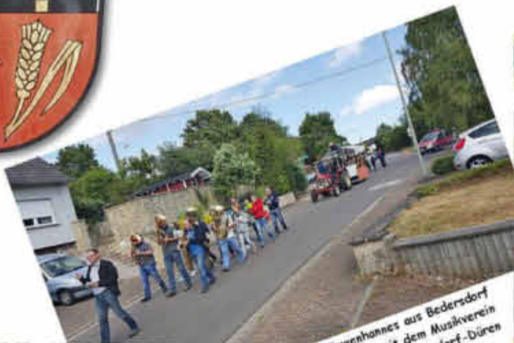
Einzug des Kirwenhannes aus Bedersdorf mit dem Musikverein Kerlingen-Ittersdorf-Büren