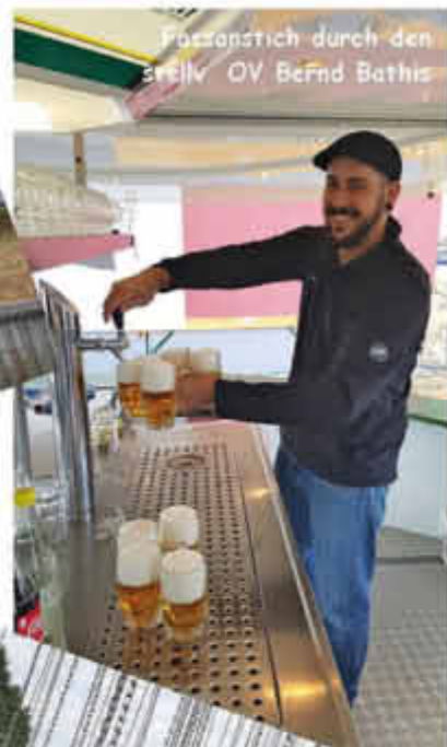
Fastenstich durch den stellv. OV BeFnd Bathis