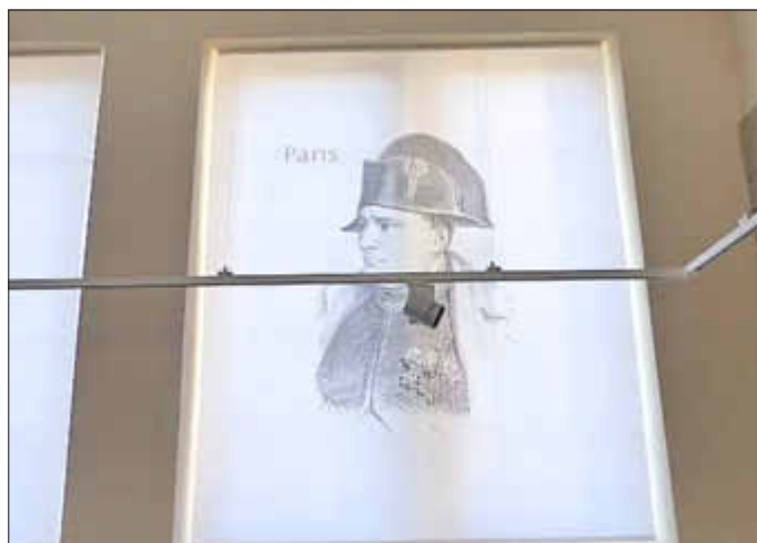
Lichtschienen und themenbezogene Vorhänge

Dementsprechend laufen hinter den Mauern des Museumsgebäudes die Vorbereitungsarbeiten in diesen Wochen auf Hochtouren. In den Ausstellungsräumen des Erdgeschosses – Mittelalter und Neuzeit - und des Untergeschosses – Vor- und Frühgeschichte, Kelten und Römer – sind die ansprechend farbig bedruckten Wandtafeln, „Inseln“ und Stelen, die in vielfältiger Weise die bedeutenden Persönlichkeiten und Ereignisse Wallerfangens veranschaulichen und erklären, schon weitgehend eingerichtet. Noch fehlen an den Stromschienen die LED-Strahler, die alles ins rechte Licht rücken sollen, und für die Medienstation, die uns beeindruckend vor Augen und Ohren führen wird, wie Wallerfanger Bürger die Schrecken des 30jährigen Krieges erlebt haben, müssen noch die Bild- und Tondokumente fertiggestellt werden.