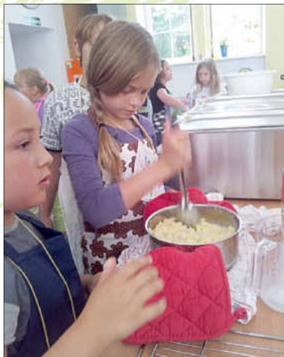
Beim Zerstampfen der Kartoffeln für den Kartoffelbrei

Eine Gruppe hat Kartoffeln gekocht und daraus Kartoffelbrei zubereitet, die andere Gruppe hat Backofenkartoffeln gemacht.