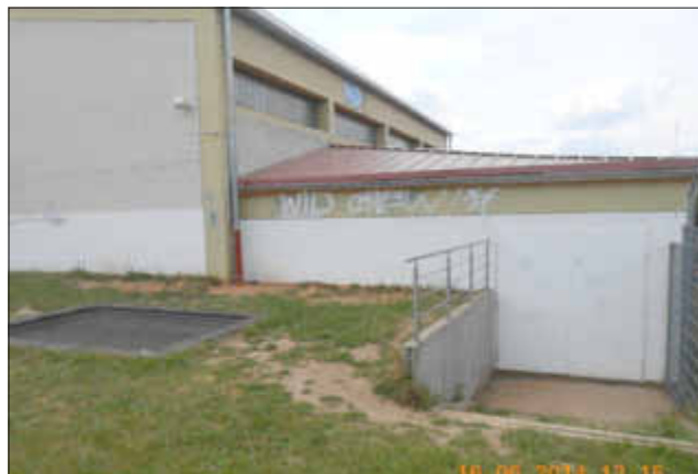
Graffitis an der Turnhalle Grundschule Gisingen.