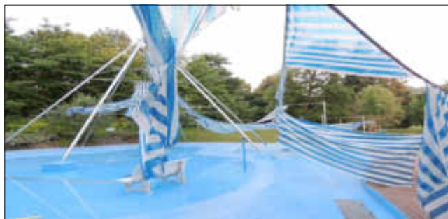
Vandalismus im Freibad: 7.000,- EUR Schaden

Die Bandbreite der Zerstörungswut geht von herausgerissenen und verbrannten Wanderbänken über abgebrannte Hundetoiletten, Graffitis etc. bis hin zur Brandstiftung.