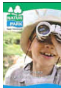
Titelbild Faltpapier „Tatort Natur“

Unter dem Motto „Tatort Natur“ - Junge Naturforscher unterwegs startete der Naturpark Saar-Hunsrück im Frühjahr 2014 seine neuen vielfältigen umweltpädagogischen Aktiv-Angebote. Zu diesem Anlass wurde ein Gewinnspiel organisiert, an dem sich Schulklassen, Kinder- und Jugendgruppen aus der Naturpark-Region beteiligen konnten.