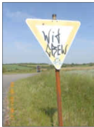
Es wurden mehr als 20 Straßenschilder beschädigt