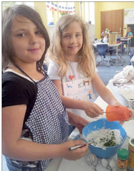
Beim Anrühren des Kräuterquarks