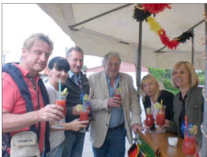
unsere Karnevals-Freunde aus Reisbach