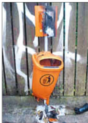
Die neu angeschafften Hundetoiletten wurden vom Tag der Aufstellung an Ziel der Verwüstungen.