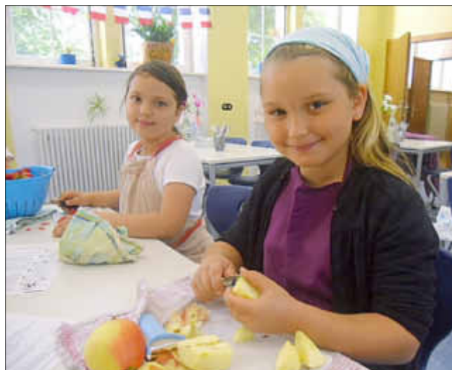
Die Äpfel werden geschält und kleingeschnitten

Die verschiedenen Quarkspeisen und Milchmixgetränke fanden großen Anklang bei den Kindern.