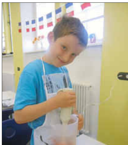
Beim Mixen der Erdbeermilch

Für den Milchmix wurden die vorbereiteten Früchte mit dem Stabmixer püriert und mit Milch aufgemixt. Auch hier mußte nur wenig Zucker zugesetzt werden. Ein Teil der Kinder entschied sich für die Zubereitung von Erdbeermilch, eine andere Gruppe bevorzugte Bananmilch.