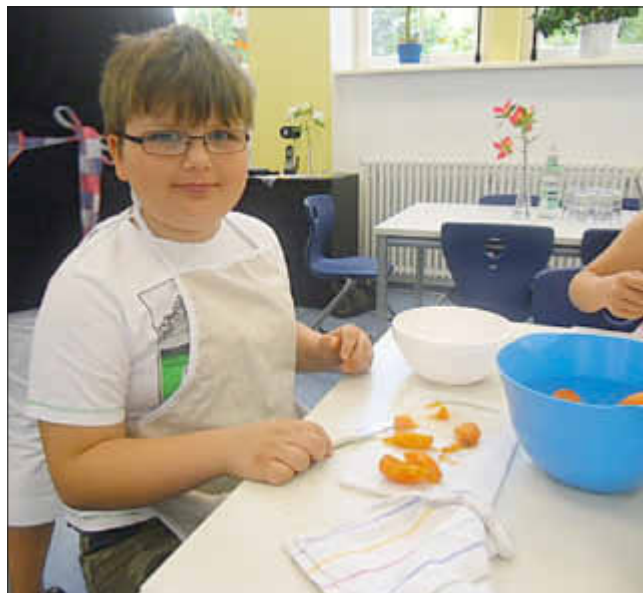
Vorbereitung der Aprikosen für den Quark

Im Umgang mit Messern, Schneebesen und Stabmixern sind die Kinder bereits sehr sicher und alles lief verletzungsfrei ab! Einige Kinder haben auch zuhause Rezepte nachgekocht bzw. Rezepte aus ihrem Begleitheft ausprobiert.