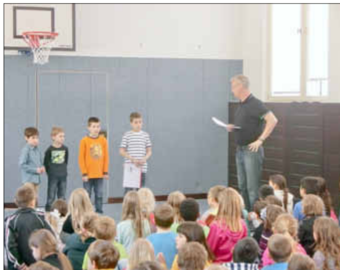
In diesem Jahr durften auch zum ersten Mal unsere Erstklässler an dem Lesewettbewerb teilnehmen, auf dem Bild die stolzen Finalisten

Gedankt sei an dieser Stelle den Eltern, die einen Kuchen gespendet haben, den zahlreichen Bücherspendern und natürlich allen Besuchern unseres Marktes, die mit zum Gelingen dieser Veranstaltung beigetragen haben. Hs