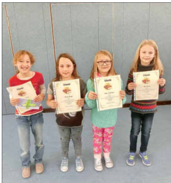
Wie alle Finalisten bekamen auch die Drittklässler eine Urkunde und der Gewinner ein vom Förderverein sponsiertes Buchgeschenk