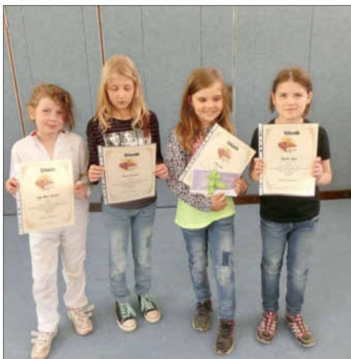
Die vier glücklichen Gewinner aus den zweiten Klassen