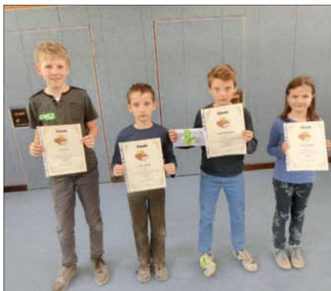
Besonders enge Entscheidungen gab es bei unseren Viertklässlern: Auf dem Bild die Leser mit der besten Tagesform