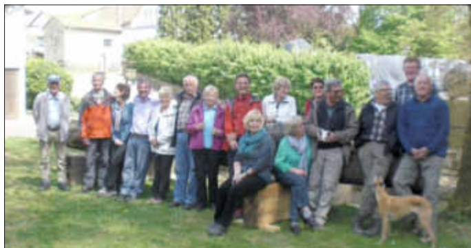
An der Wanderhütte in Rammelfangen