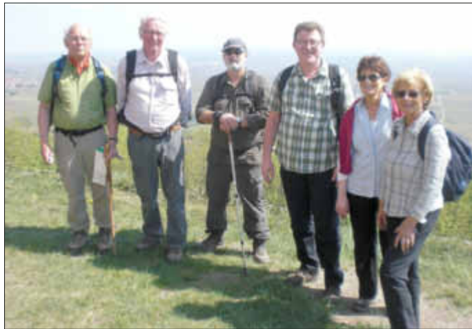
Hinter der St. Anna Kapelle

2. Am Karfreitag, dem 18. April 2014, fand nicht der geplante Tilemann-Stella-Weg statt, sondern kurzfristig wurde entschieden, den Bach- und Burrenfeld bei Hüttersdorf zu erwandern. Dieser schöne Weg mit seinen 13 Kilometern wird für den 4. Mai 2014 noch einmal angeboten.