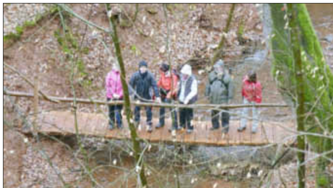
Auf der Brücke über den Mühlenbach