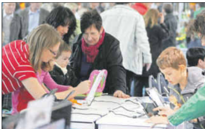
Ausprobieren ist hier nicht nur erlaubt, sondern ausdrücklich erwünscht. Die 66. Internationale Saarmesse bietet für Jung und Alt etwas. Sie ist eben eine Messe für die ganze Familie.