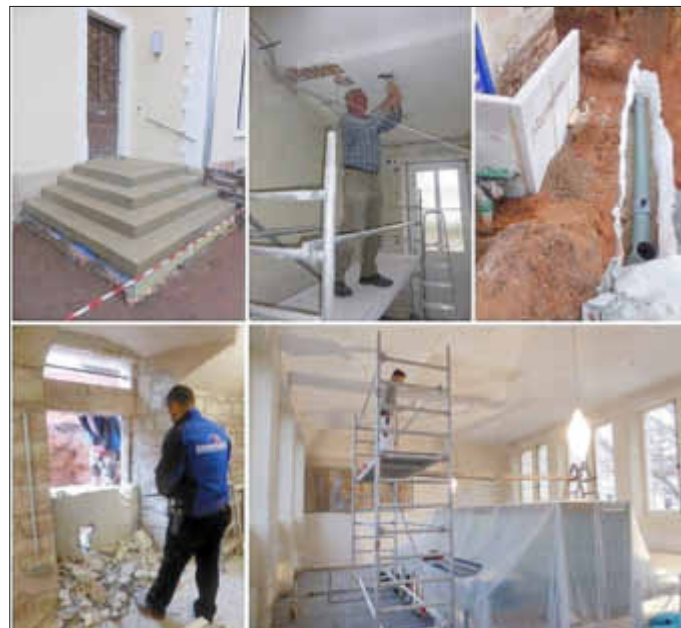
Arbeiten in und um das Museum Wallerfangen

Text: Friedel Jacob, Bilder: Klaus Eisenbarth