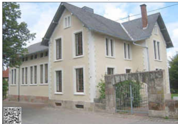
Heimatmuseum mit dem „neuen“ Eingang