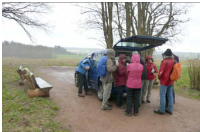
Fingerfood aus dem Speisewagen

Die Mühlenbach-Schluchtentour bei Saarwellingen war aber verregnet und der starke, eiskalte Wind setzte den Wanderern zu. Doch am Speisewagen konnten sich alle aufwärmen und stärken.