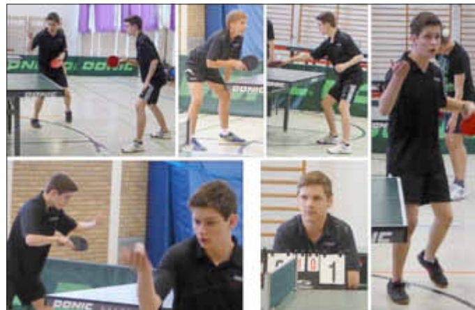
1. Jugend in Aktion