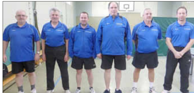
1. Senioren - 3. in der Landesliga

Mehr über den Verein und seinen Aktivitäten erfahren Sie unter: www.ttc-wallerfangen.de