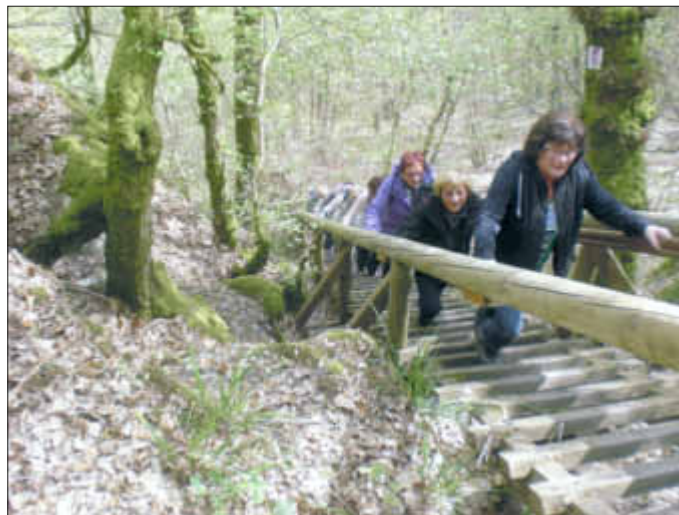
Auf der Treppe