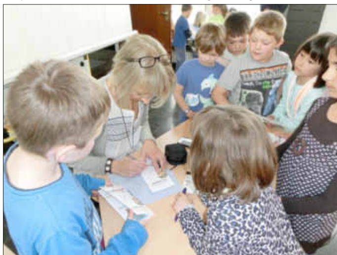
Großer Ansturm von Autogrammjägern nach der Lesung