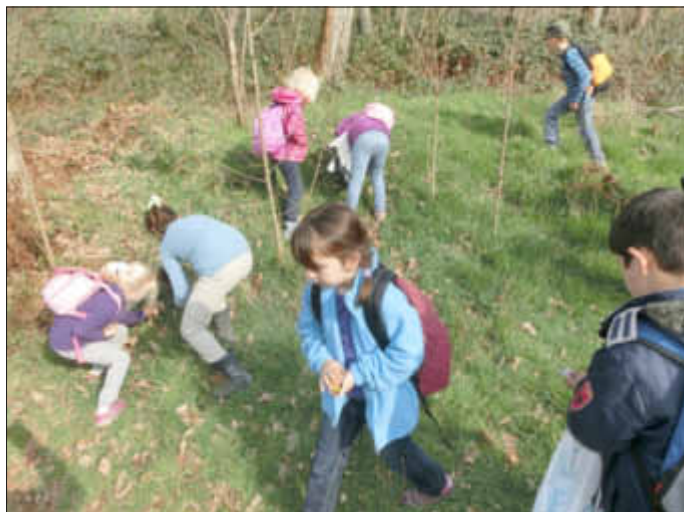
Sorgfältiges und systematisches Absuchen des gesamten Suchgebietes