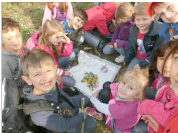
Am Ende waren alle mit der „Ausbeute“ hochzufrieden