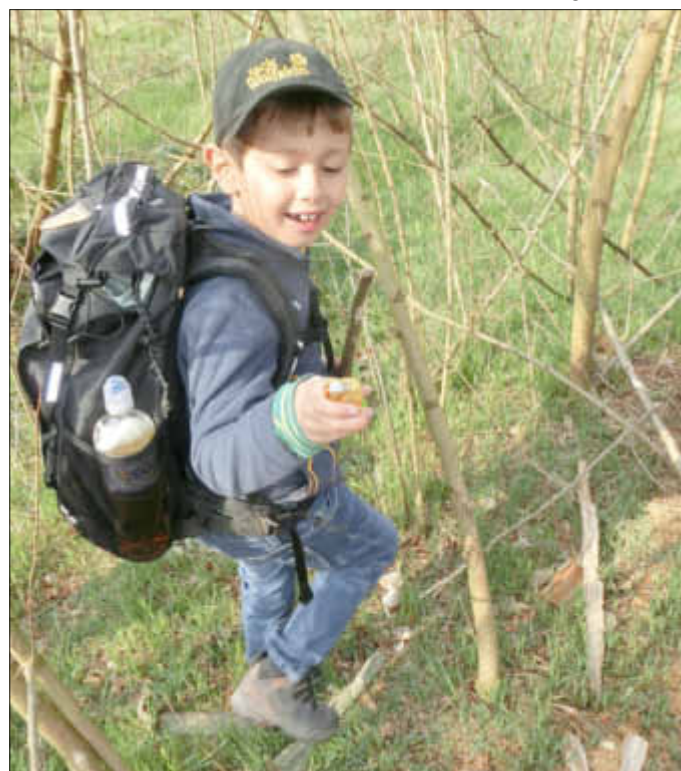
Eine gute Ausrüstung ist das A und O einer erfolgreichen Ostereiersuche im Wald

Die anstrengende Suche wurde belohnt, konnte man doch am Ende die Papiereier gegen leckere Schokoladeneier umtauschen. Ein erstes Picknick im Freien rundete einen besonders schönen Wandertag ab. hs