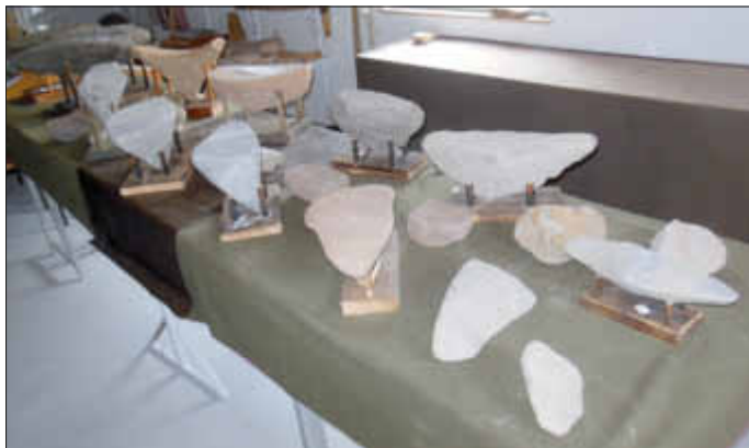
Napoleonshüte aus Basaltlava