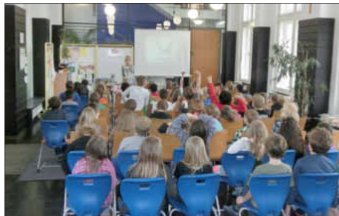
Unsere Aula war bei beiden Lesungen bis auf den letzten Platz besetzt.

Alle Schüler freuen sich auch schon auf den schulinternen Lesewettbewerb , an dem in diesem Jahr zum ersten Mal auch schon die Erstklässler teilnehmen können. Die besten Leser aus jeder Klasse dürfen am Donnerstag vor einer Jury ihr Können unter Beweis stellen. Die große Siegerehrung findet am letzten Schultag vor den Osterferien in der Aula statt. hs