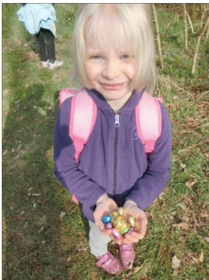
Die ersten Funde wurden stolz präsentiert