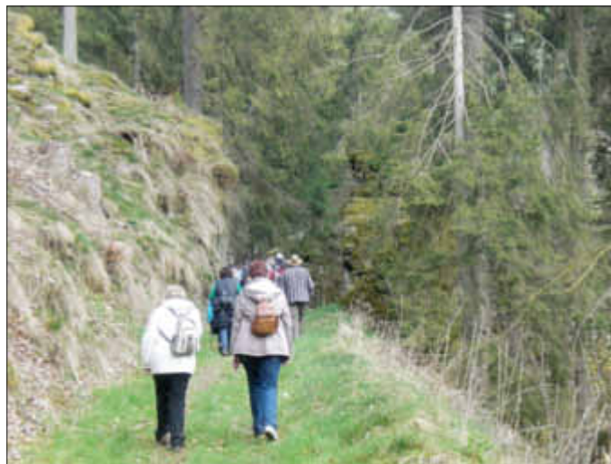
Durchs „Steinerne Tor“

1. Am Sonntag, dem 6. April 2014, wurde im Rahmen der Traumschleifen-Wanderung eine Wanderung auf dem Rockenburger Urwaldpfad durchgeführt. Durch tief eingeschnittene Täler, die im Laufe von Jahrmillionen durch die kleine Drohn entstanden, ging der Premiumwanderweg durch ein romantisches Urwaldgebiet. Die kleine Drohn ist der größte Zufluß der Drohn, die im Idarwald entspringt und ein Nebenfluß der Mosel ist. Bei Neumagen-Drohn fließt sie in die Mosel, nach nur 36 km. Die kleine Drohn hat eine Länge von 29 km. Besondere Sehenswürdigkeiten war unter anderem der Ort Prosterah mit seinen wunderbaren Aussichten und seinen mächtigen Quarzitefelsen, die mitten im Ort für manchen Hausgarten einen »gigantischen Steingarten« ermöglichten, heißen Prosterather Wacken. Diese haushohen Quarzitefelsen haben seit Jahrmillionen diese Landschaft geprägt. Das »Steinerne Tor«, zwei in Felsriegel gehauene Durchlässe, wurde von Menschenhand erschaffen, um auf diesem Weg Holz abfahren zu können. Der definitiv anspruchsvollste Teil dieser schönen Wanderung war der Anstieg zur Treppe und die Treppe selbst. Anstrengend aber sehr schön. Nach insgesamt 12 km konnten wir uns in der schönen Fischerhütte in Beuren gut erholen. Vielen Dank an Hermann und Anita Speicher für die Auswahl dieser schönen Wanderung. Und für den Scheidebecher.