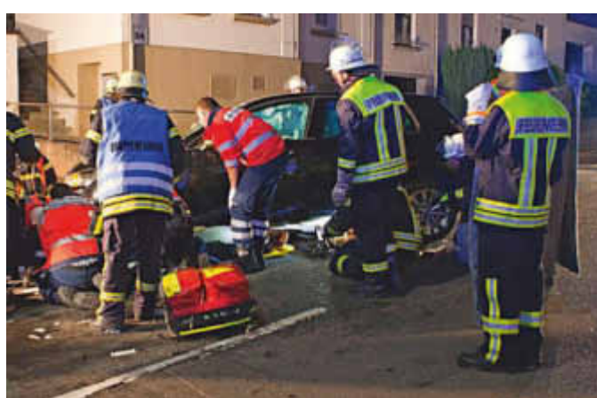
Verkehrsunfall in Wallerfangen