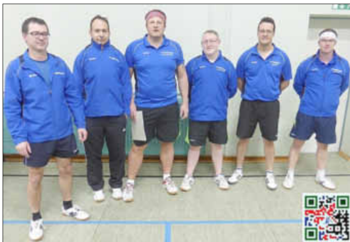
1. Herren auf dem Weg zur Meisterschaft

21.03.2015 Sa 18.30 JC Wadrill - TTC Wallerfangen 1 21.03.2015 Sa 19.30 TTC Wallerfangen 2 – Wallerfangen 3 21.03.2015 Sa 19.30 Wallerfangen 4 - TTSV Fraulautern 3 21.03.2015 Sa 15.00 1. Jugend – ATSV Saarbrücken 21.03.2015 Sa 15.00 2. Jugend - TTG Dillingen 18.03.2015 Mi 19.30 1. Senioren – TTSV SLS-Fraulautern 25.03.2015 Mi 20.00 2. Senioren – TTG Dillingen 3 Mehr über den Verein und seinen Aktivitäten erfahren Sie unter: www.ttc-wallerfangen.de