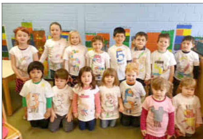
Auch so können Zahlen aussehen...