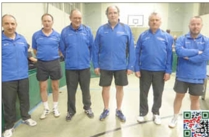
Die 2. Herren sind schon Meister.