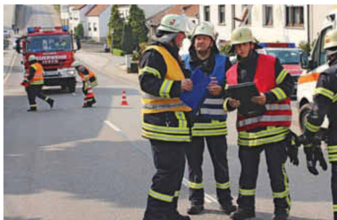
Übung anlässlich Gemeindefeuerwehrtag

Neben Einsätzen standen auch zahlreiche Ausbildungen sowie Ordnungsdienste auf dem Programm. Insgesamt 1.819 Stunden leistete der neue Löschbezirk „West“ im vergangenen Jahr für die Bürger der drei Ortsteile Jhn, Leidingen und Rammelfangen.