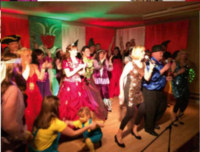
Finale mit den Konfettis