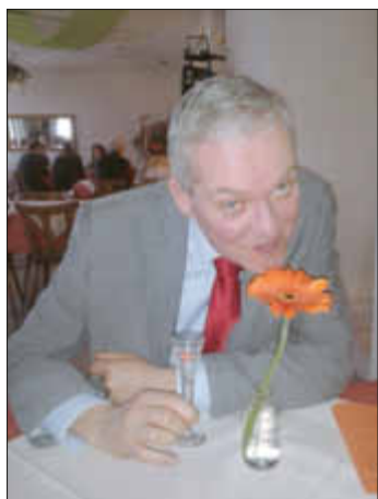
Wallerfangen - Blühende Landschaft!

Sehr geehrte Infostandbesucherinnen und Infostandbesucher, Liebe Abwesendgebliebene Die Partei Die PARTEI Wallerfangen möchte in einer ausführlichen Momentaufnahme, einen zukunftssträchtigen Blick zurück auf die Durchführung der Infostände der Partei Die PARTEI Wallerfangen vom 26.02.14 und 05.03.14 werfen: Die beiden Infostände waren, wie nicht anders zu erwarten, ein voller Erfolg! Insgesamt wurde beim Heringsessen eine ganze Tüte „Katjes - Salzige Heringe“ verzehrt, ungefähr sechs Kirschnaps und 5 „Jägermeister“ fanden ihren Abgang bei der Laufkundschaft!