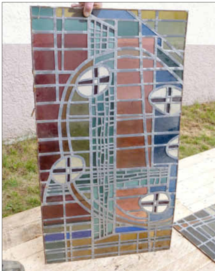
Eines der 6 Fenster