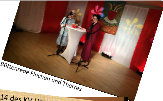
Büttenrede Finchen und Therres