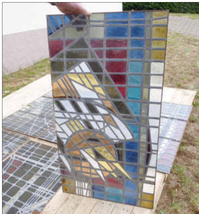
Eines der 6 Fenster

Um die Finanzierung weiter voranzubringen wird am Ostermontag, nach dem Gottesdienst um 10.30 Uhr, ein Kuchenverkauf stattfinden, der Erlös ist für den Einbau der Kirchenfenster. Die Rammelfanger Mitglieder des Kirchengemeinderates stehen dann auch für Fragen zur Verfügung. Fotos der 6 Fenster hängen ab sofort in der Kirche aus.