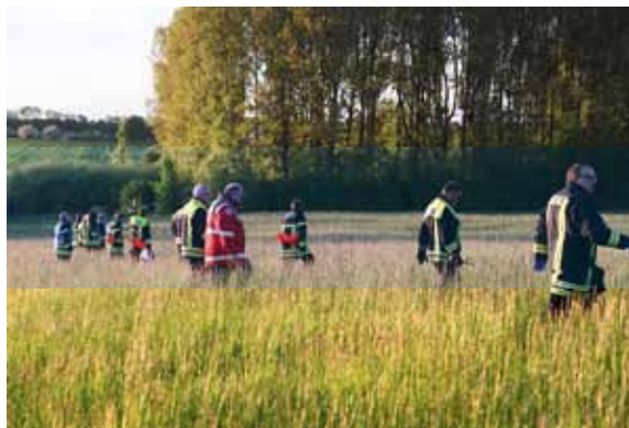
Personensuche in Düren

Insgesamt 76 Einsätze mussten in der Gemeinde abgewickelt werden. Von den 76 Einsätzen waren 18 Brände und 40 Technische Hilfeleistungen. Zu den Technischen Hilfeleistungen zählen Verkehrsunfälle, Ölsuren, Nottüröffnungen, Wassereintritte, umgestürzte Bäume, Tierrettung und noch vieles mehr. Auch die im St. Nikolaus Hospital installierte Brandmeldeanlage ließ die Feuerwehr 14mal ausrücken. So kam die Wehr auf rund 1235 Einsatzstunden .