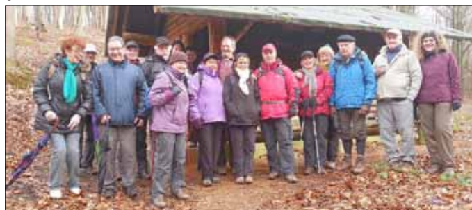
Nach der Mittagsrast