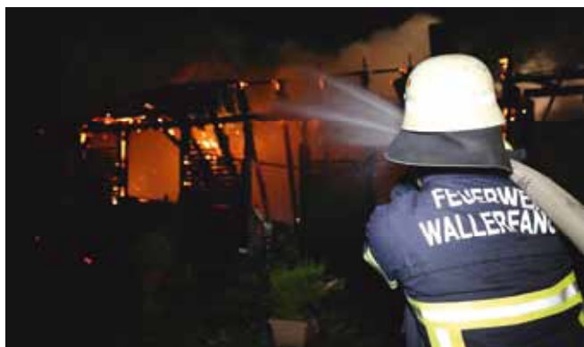
Brand eines Wochenendhauses in Wallerfangen

In seinem Tätigkeitsbericht blickte er auf ein arbeitsreiches Jahr zurück. Derzeit engagieren sich rund 160 Aktive, darunter 10 Frauen, in den sechs Löschbezirken der Feuerwehr der Gemeinde Wallerfangen.