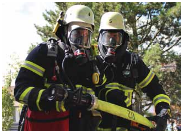
Übung am Gemeindefeuerwehrtages in Gisingen

Um für ein derart breites Einsatzspektrum gerüstet zu sein, muss das Fachwissen ständig aufgefrischt werden. Dafür führen die einzelnen Löschbezirke regelmäßig Übungen durch. Im vergangenen Jahr kamen so 4576 Ausbildungsstunden zusammen. Zusätzlich besuchten zahlreiche Feuerwehrangehörige weiterführende Lehrgänge auf Kreis- und Landesebene.