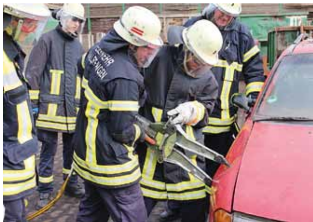
Übung Technische Hilfe

Die Feuerwehr Wallerfangen ist aber nicht nur aktiv, wenn ein Schadensereignis eintritt oder um sich mit Ausbildungen darauf vorzureiten. Eine Feuerwehr ist auch immer ein Teil des kulturellen Lebens in der Gemeinde. Martinsumzüge, Ordnungsdienste, Volkstrauertag, kirchliche Veranstaltungen, Feuersicherheitswachen sind nur einige Beispiele ehrenamtlich geleisteter Stunden zum Wohle der Bürgerinnen und Bürger der Gemeinde. Und auch die Fahrzeuge und die Gerätehäuser bedürfen der regelmäßigen Wartung und Pflege. So kamen weitere 3509 Stunden dazu.