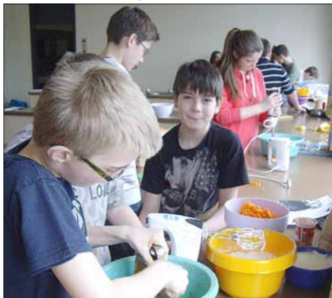
die eifrigen Köche