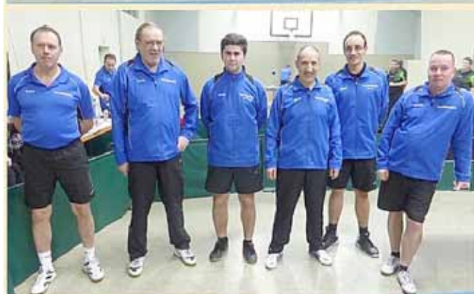
1. Herren und 2. Herren des TTC Wallerfangen