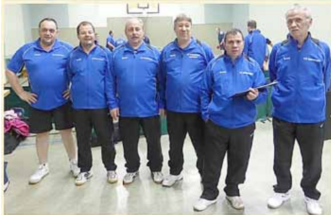
1. Senioren und 2. Senioren des TTC Wallerfangen