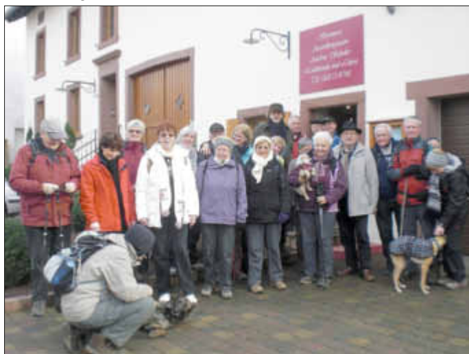
Vor der Brennerei Scholtes in Fürweiler