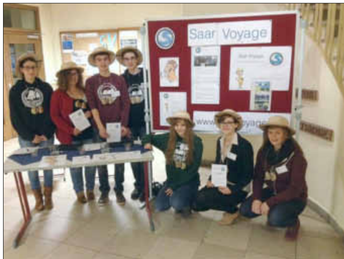
Das Team von Saar Voyage