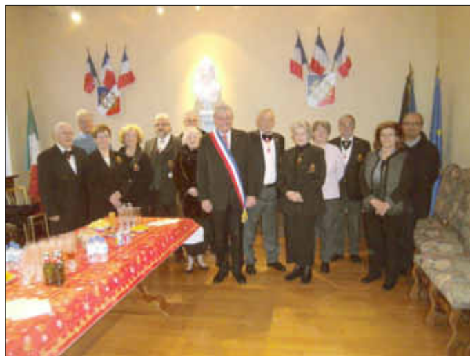
Empfang im Rathaus L'Hopital