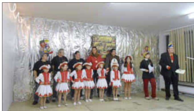
Vorstand und Tanzgruppe De Schnokenschießer