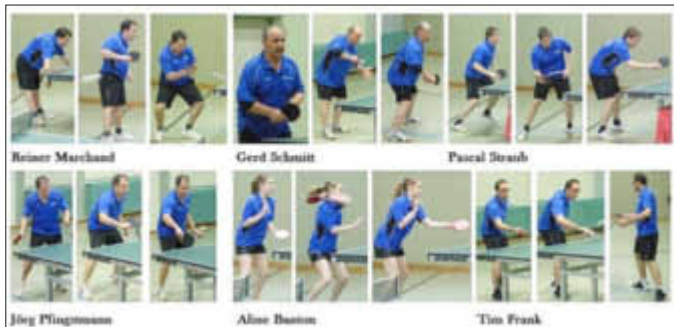
3. Mannschaft des TTC Wallerfangen in Aktion

Mehr über den Verein und seinen Aktivitäten erfahren Sie unter: www.ttc-wallerfangen.de