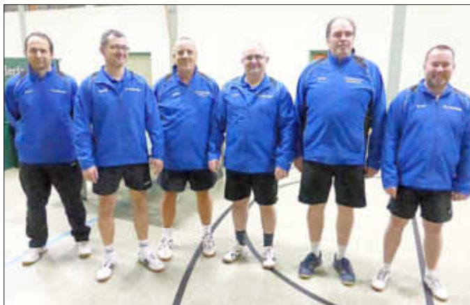
1. Senioren bleiben dritte in der Landesliga