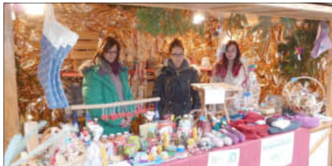
Stand der Schule am Limberg

Mit Unterstützung der Eltern, Schüler, Lehrer, unserer aller Mitarbeiter, unserer Freunde und Gönner möchte die Schule am Limberg ihr soziales Engagement weiterhin aufrechterhalten und bedankt sich auch im Namen ihrer Patenschule in Beaumont/Haiti ganz herzlich.