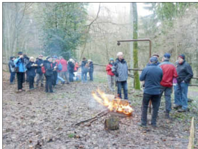
Lagerfeuer an der Saarwald-Vereins-Hütte in Itzbach