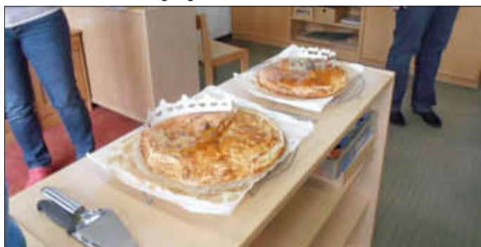
La galette des rois

1 Blätterteig mit Marzipan oder Apfelmus „füllen“, Glücksbringer hineingeben, 2. Blätterteig als „Deckel“ daraufgeben, mit dem zerschlagenen Ei bestreichen und bei 180 Grad Celsius ca. 20 - 25 Min. backen. Nach dem Abkühlen die Krone auf den Kuchen setzen, bis der Kuchen aufgeteilt und der Glücksbringer gefunden ist.