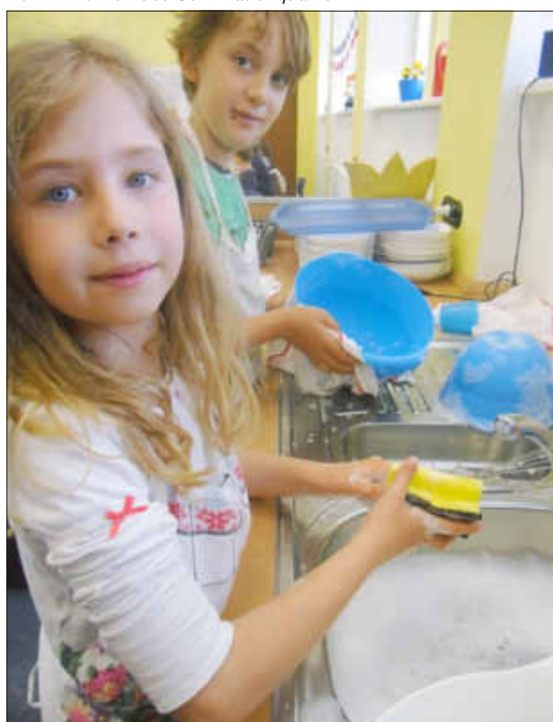
Eifrig beim Spülen