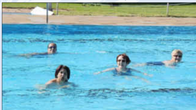
Fröhliche Gesichter im Schwimmbecken bei 22 Grad Wassertemperatur

Auch in diesem Jahr gab es ein kleines Eröffnungsfest. Mit einem Glas Sekt oder Orangensaft stießen die Stammgäste auf die neue Saison an, die sie bereits seit dem letzten Herbst herbeigesehnt hatten.