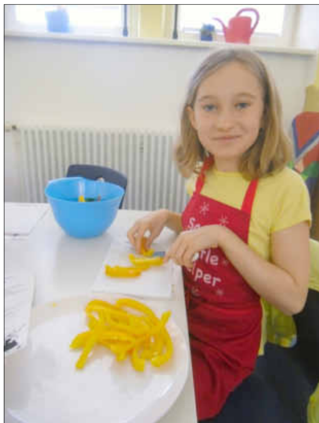
Beim Vorbereiten des Knabbergemüses