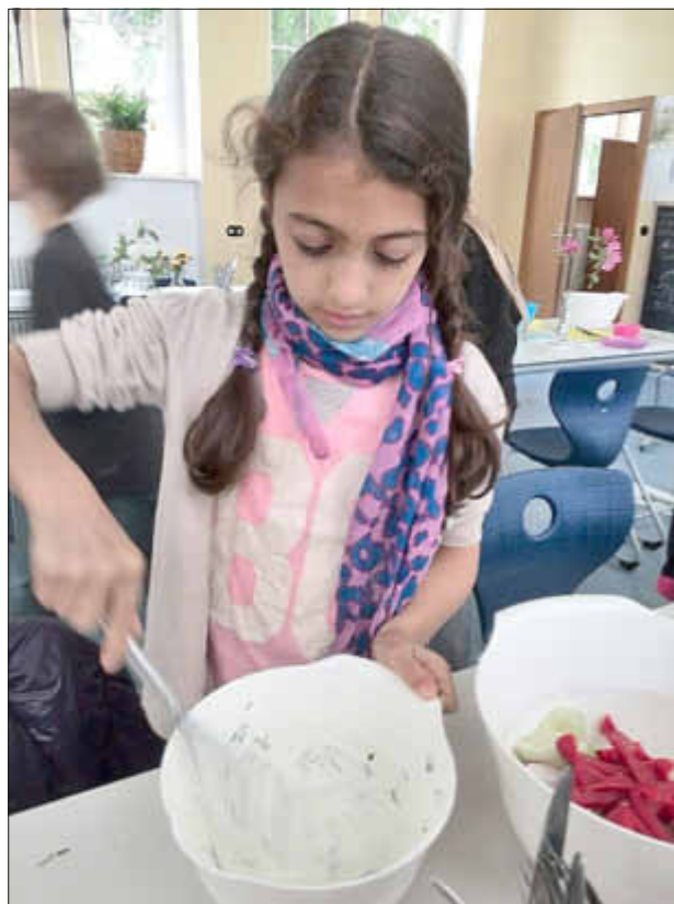
Beim Anrühren des Schnittlauchquarks

Und wie es sich für einen Kochkurs gehört, wurde im Anschluss auch alles wieder gespült und aufgeräumt.